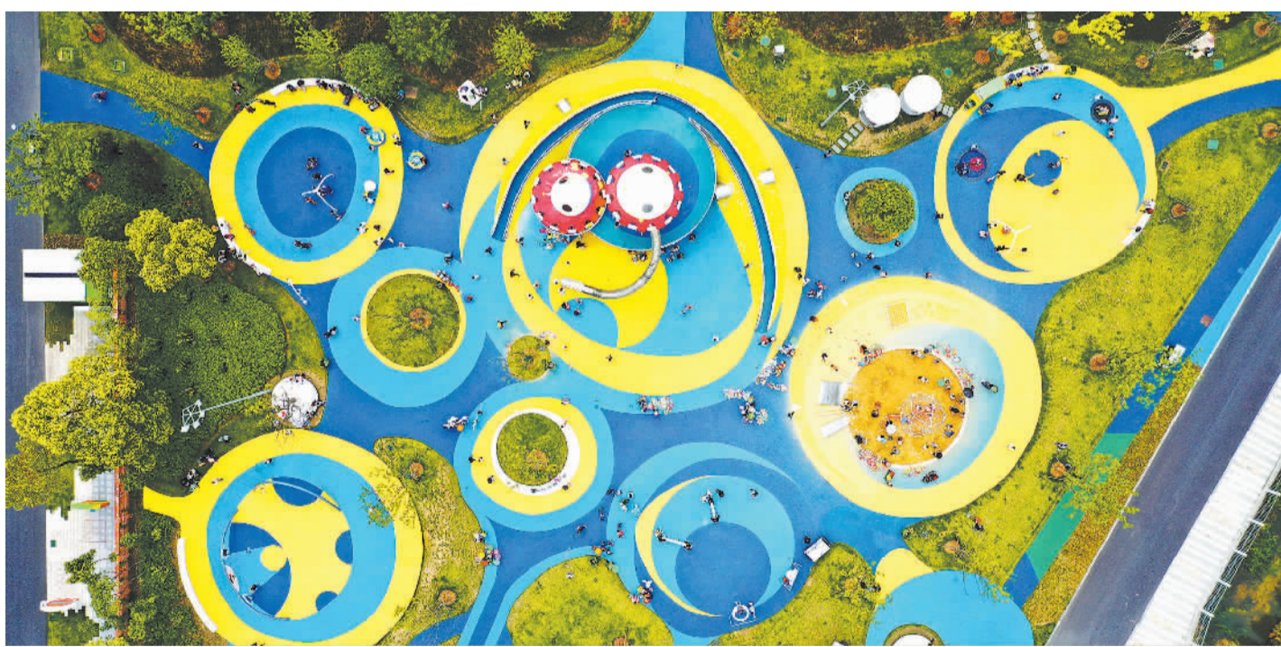
4月21日,安徽省合肥市不少市民来到合肥园博园赏春游玩。合肥园博园是由骆岗机场改建而成的城市公园,区域规划面积323公顷,总体布局为“三区一馆”,包括百姓舞台展区、生态园林展区、城市更新展区和城市建设馆。

可以说,公共空间作为城市的重要组成部分,其开放与利用不仅关系市民的生活质量,也影响着城市的可持续发展。因此,城市管理者应继续加大对公共空间和绿色空间的投入与规划力度,推动更多类似的开放项目落地实施;同时,还应加强与市民的沟通和互动,充分了解市民的需求与期望,确保公共空间的规划与管理更加符合市民的期待。对市民来说,也应提高自身的公共意识和责任意识,自觉遵守公共空间的使用规则和公约,共同维护好我们的公共空间和绿色环境。