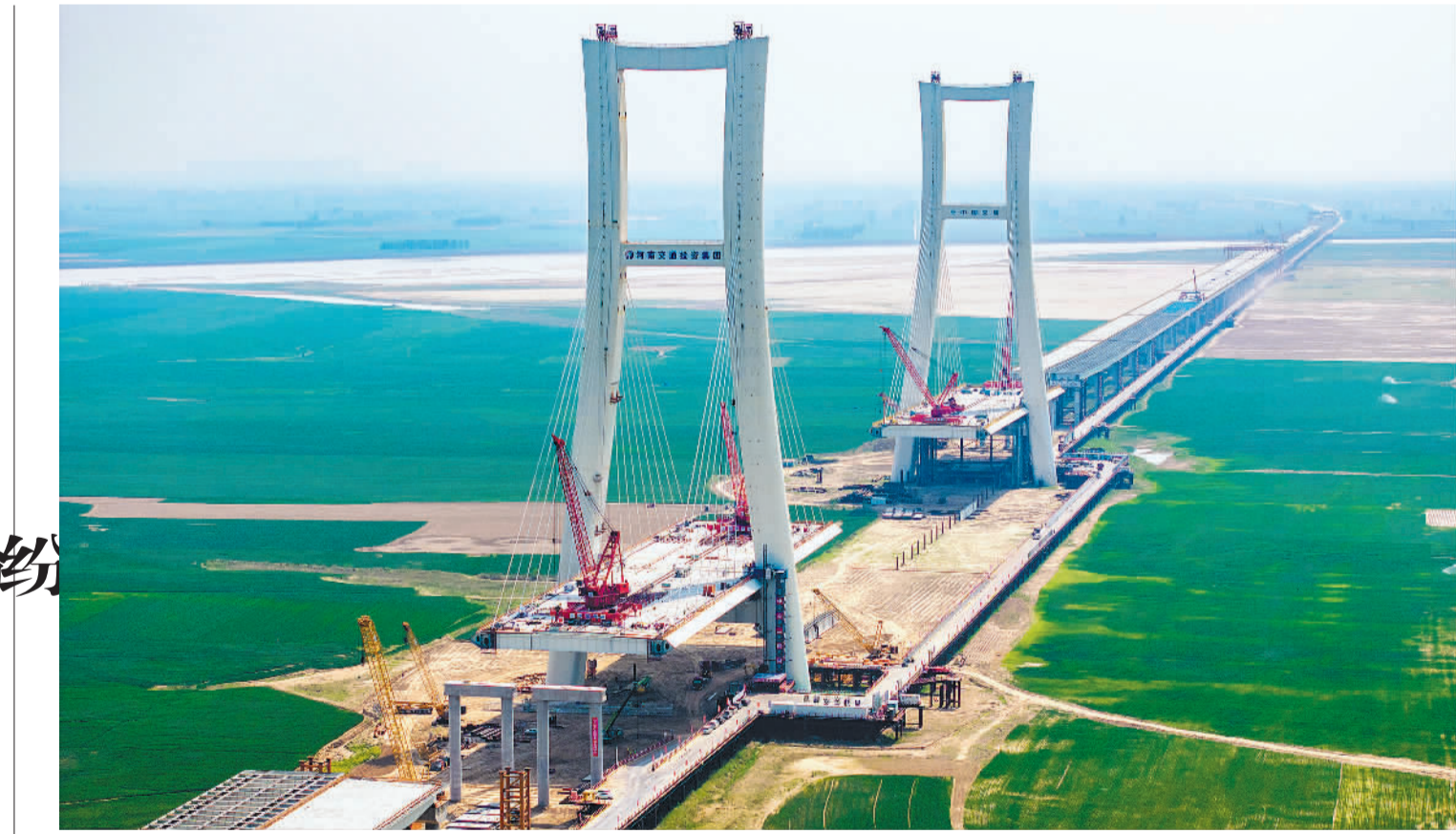
4月21日,河南省新乡市原阳县,安罗高速黄河特大桥正在紧张施工。该大桥为国家高速网京武高速的控制性工程,预计2025年建成通车。安罗高速全线建成通车后,将有效缓解京港澳高速交通压力。

业内专家认为,当前,银行下架中长期大额存单主要因为银行净息差仍持续承压。在资产端投放相对乏力的情况下,银行压低成本较高的中长期定期存款或存单,有利于管理净息差。中国邮政储蓄银行研究员姜飞鹏表示,目前国内银行净息差处于较低水