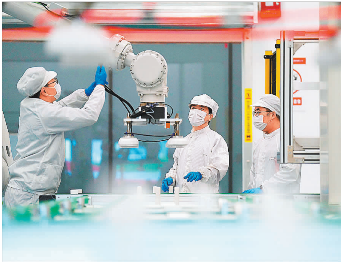
▼4月12日,位于北京城市副中心的新源劲吾(北京)科技有限公司生产车间,员工在查验生产设备。该公司以自主研发的高端制造设备、核心大数据算法以及光固化型特殊油墨材料为支撑,争当新兴产业领域发展的先行者。