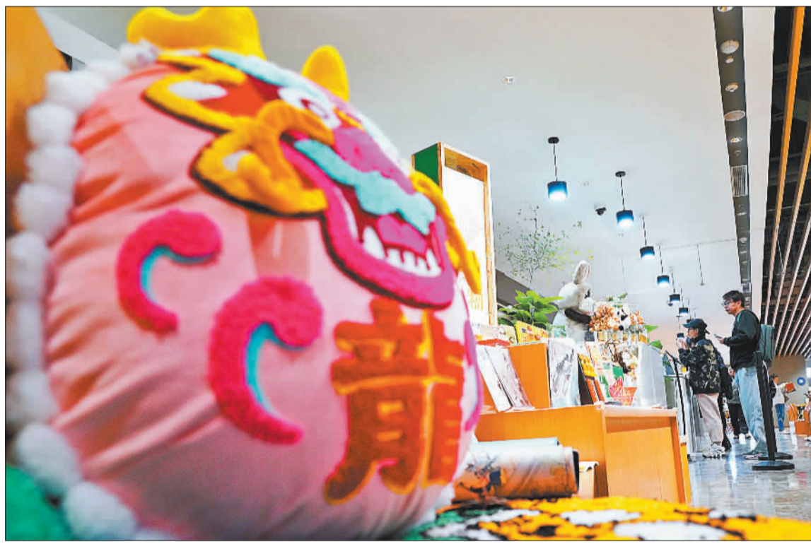
▲4月9日,位于北京城市副中心的北京城市图书馆,读者在选购文创产品。该图书馆内部建有世界最大单体图书馆阅览室、国内藏量最大智能化立体书库、国内首家综合性非遗文献阅览空间。