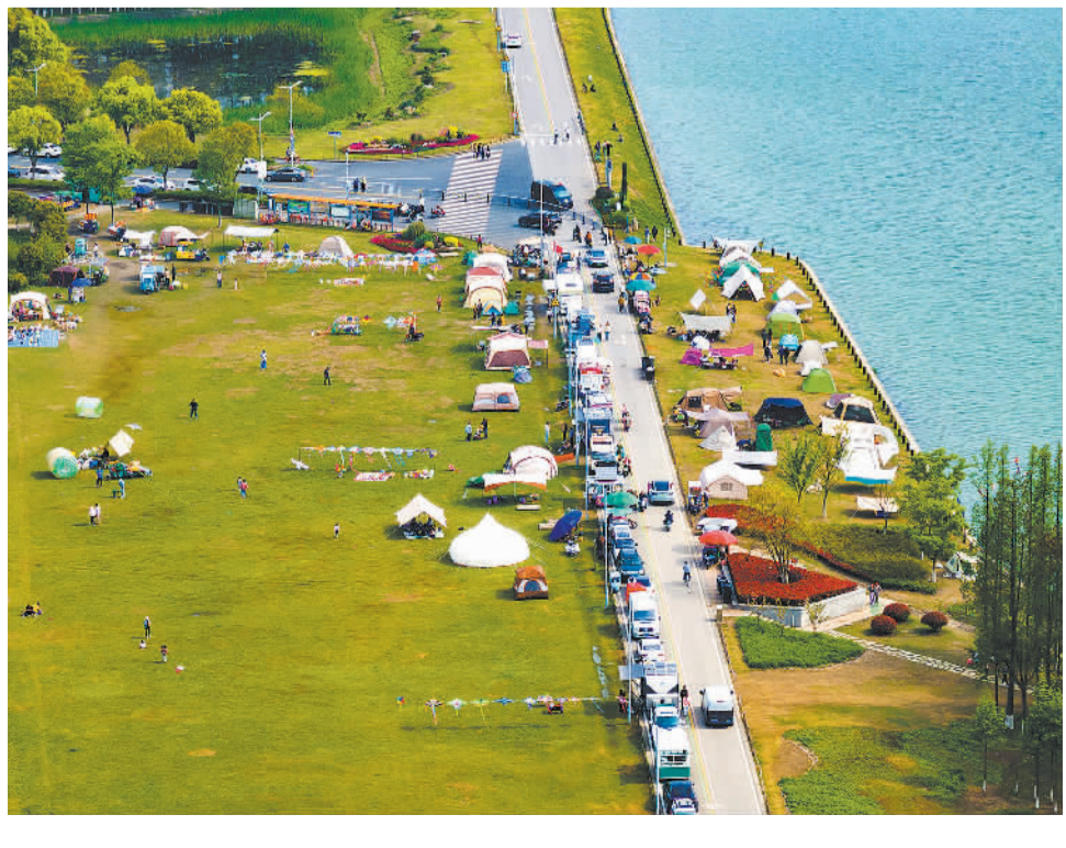
4月14日，江苏省昆山市淀山湖畔，春色烂漫，正值赏樱好时节，众多市民和游客来此露营休闲，享受春日周末时光。

此外，天津河东区还发挥“门户”优势，以天津站为起点建设了8.28公里沿海“金创走廊”。渤海银行大厦、嘉里中心、中海城市广场、金茂汇、万达中心、棉3创意街区等200多万平方米新建载体形成了创业投资、宜居宜业的良好环境。