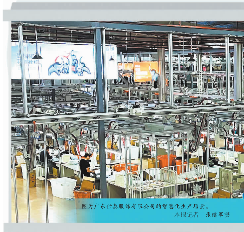
图为广东世泰服饰有限公司的智慧化生产场景。

2022年至今，汕头纺织服装产业共有108个项目开工投产，总投资319.3亿元，其中产业基础设施总投入158亿元。当前，率先布局的全球纺织品采购中心、智能化纺织服装产业园、展会展览中心、产业总部大厦等汕头“四大工程”建设正有序推进。