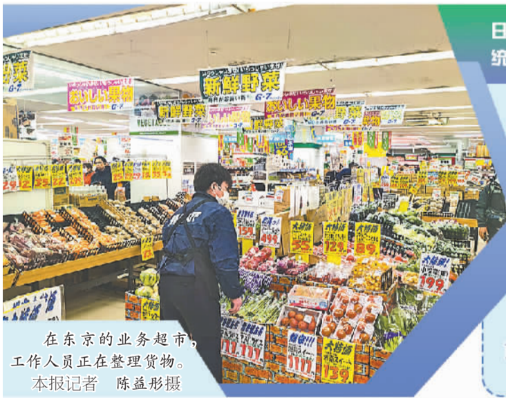
在东京的业务超市,工作人员正在整理货物。