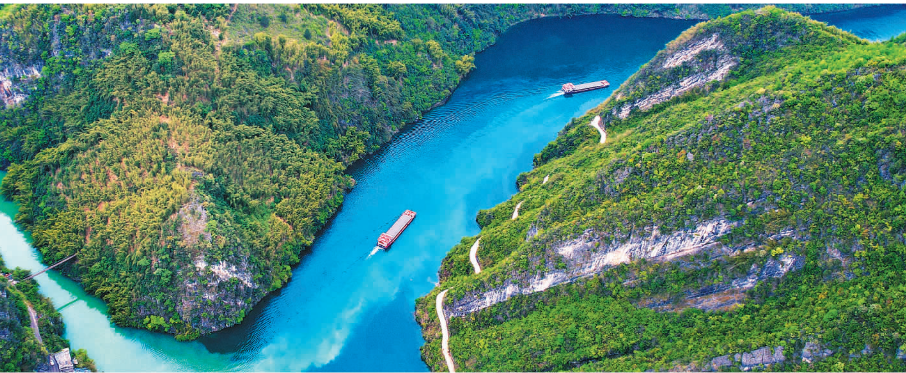
4月10日，两艘满载矿石的货船通过贵州省铜仁市沿河土家族自治县乌江银童峡。乌江全线复航以来，成为贵州水泥、磷矿、铝土矿等货物出黔运输的重要通道，年吞吐量在500万吨至800万吨之间。

2个月，规模以上工业增加值增速9.4%，高于全国2.4个百分点。未来，山东将坚定实施工业经济头号工程，聚焦人工智能、量子科技、深海空天等七大未来产业，打造一批先导区和特色园区，加快塑造新型工业化新优势。