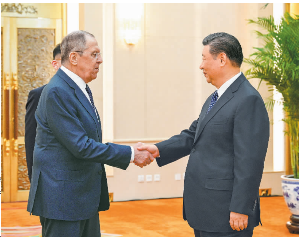
俄罗斯外长拉夫罗夫于4月9日下午在北京人民大会堂会见国家主席习近平。