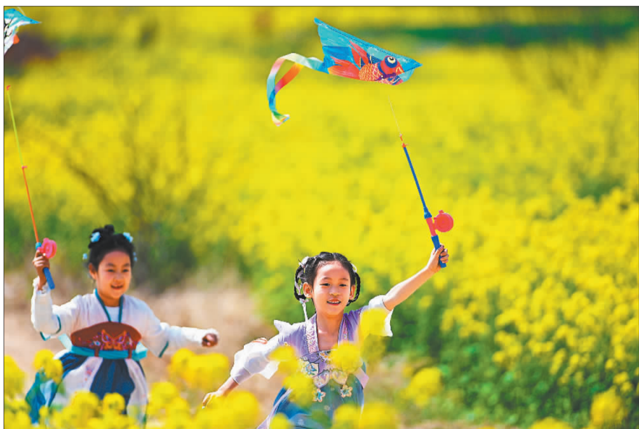
▲3月30日,山东省滕州市官桥镇,放风筝的小朋友奔跑在油菜花田。