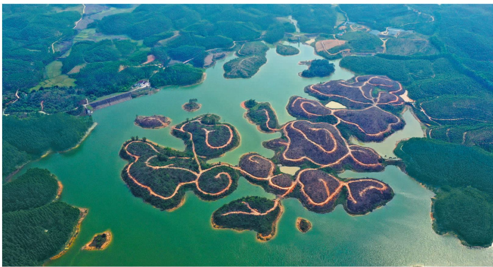
4月2日，广西融水苗族自治县标江水库，宛如一幅美丽的生态画卷。近年来，当地不断提升水库防洪抗旱能力，打通了农田用水难的“最后一公里”，保障粮食安全，增加农民收入。

一版编辑 温宝臣 张可 二版编辑 田杨 刘兴 三版编辑 杜铭 林紫晓 美编 吴迪