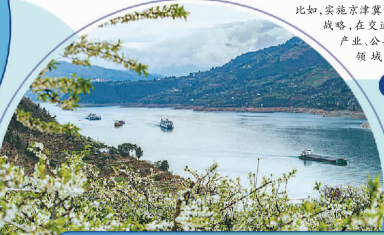
3月25日，重庆市巫山县曲尺乡长江两岸李花绽放。

另一方面，理顺各生态治理主体关系，优化生态治理结构，形成生态治理推动绿色发展的有效过程。在生态产品价值转化为经济价值的过程中，要充分发挥市场在资源配置中的决定性作用，实现有为政府、有效市场的充分结合。进一步理顺政府、企业、非政府组织、普通民众等各生态治理主体之间的关系，实现多元主体间相互协调与合作，发挥各主体在生态治理中的相互协作作用，使多元参与主体共同发展，整体获益，形成合作效应。