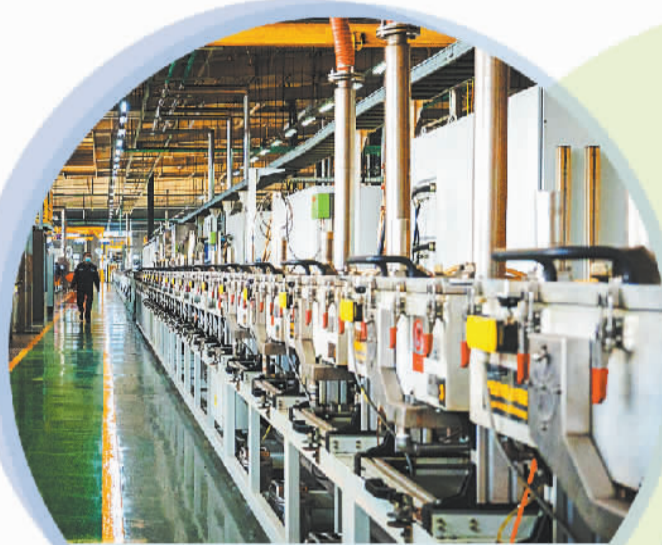
位于秦皇岛经开区的邦迪管路系统有限公司。