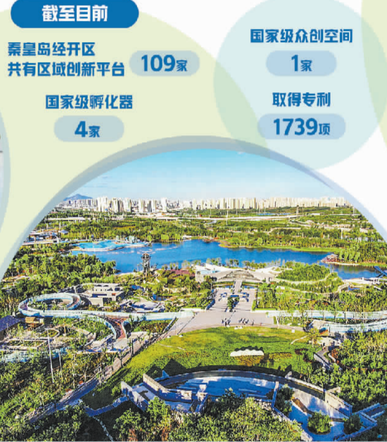
俯瞰秦皇岛经开区。