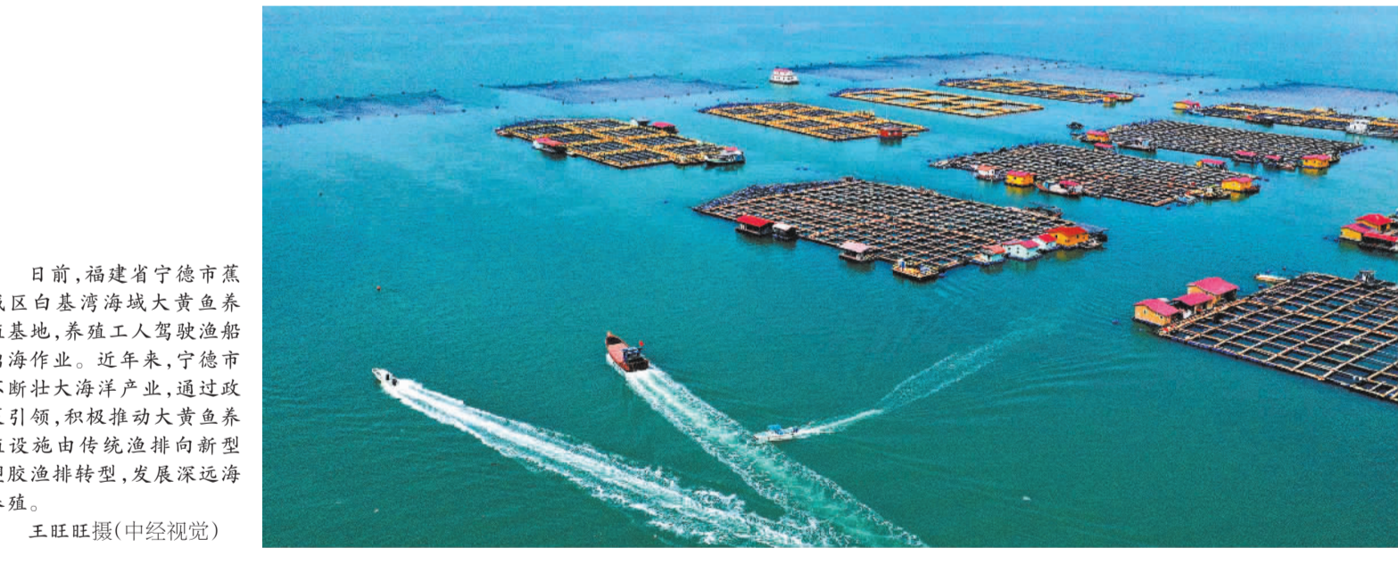
日前，福建省宁德市蕉城区白基湾海域大黄鱼养殖基地，养殖工人驾驶渔船出海作业。近年来，宁德市不断壮大海洋产业，通过政策引领，积极推动大黄鱼养殖设施由传统渔排向新型塑胶渔排转型，发展深远海养殖。