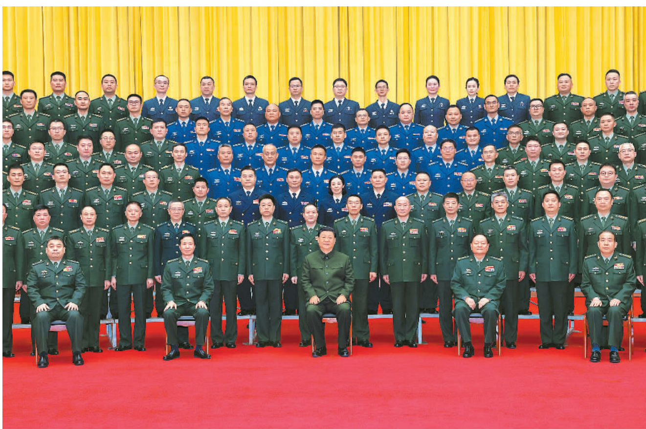
3月18日至21日,中共中央总书记、国家主席、中央军委主席习近平在湖南考察。这是20日上午,习近平在长沙亲切接见驻长沙部队上校以上领导干部,代表党中央和中央军委向驻长沙部队全体官兵致以诚挚问候。

习近平强调,湖南要更好担负起新的文化使命,在建设中华民族现代文明中展现新作为。保护好、运用好红色资源,加强革命传统和爱国主义教育,引导广大干部群众发扬优良传统、赓续红色血脉,践行社会主义核心价值观,培育时代新风新貌。探索文化和科技融合的有效机制,加快发展新型文化业态,形成更多新的文化产业增长