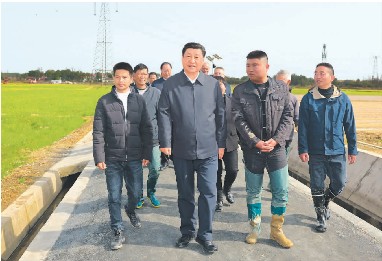
3月18日至21日,中共中央总书记、国家主席、中央军委主席习近平在湖南考察。这是19日下午,习近平在常德市鼎城区谢家铺镇港中坪村,同种粮大户、农技人员、基层干部亲切交流。

新华社长沙3月21日电 中共中央总书记、国家主席、中央军委主席习近平近日在湖南考察时强调,湖南要牢牢把握自身在构建新发展格局中的战略定位,坚持稳中求进工作总基调,坚持高质量发展不动摇,坚持改革创新、求真务实,在打造国家重要先进制造业高地、具有核心竞争力的科技创新高地、内陆地区改革开放高地上持续用力,在推动中部地区崛起和长江经济带发展中奋勇争先,奋力谱写中国式现代化湖南篇章。