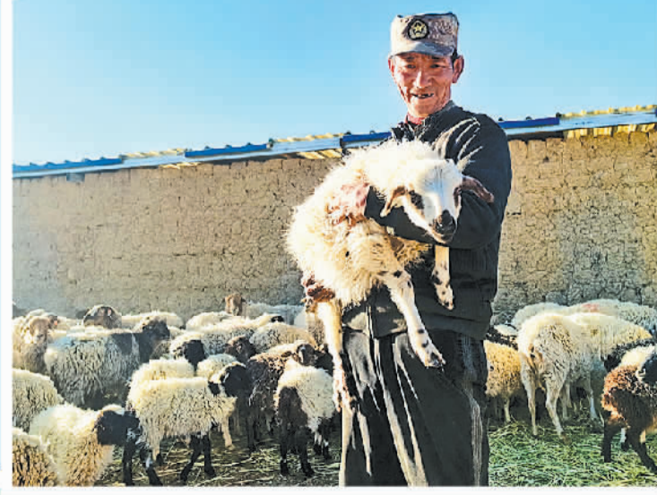
西藏日喀则市岗巴县岗巴镇雪村牧民抱着岗巴羊。

歌+嗦粉”旅游线路，丰富文旅消费。鱼峰区还成立“柳州鱼峰歌圩”文化旅游产业联盟，为各大旅行社和各螺蛳粉企业搭建研学旅游桥梁。 发展山歌经济，让一座唱歌的山带火一座唱歌的城，离不开山歌价值导向、文化品位和管理秩序等方面的持续提升。为更好推动文旅产业融合发展，柳州市下定决心，要把“歌仙刘三姐”文化旅游做起来。 “壮族三月三”就要来了，歌圩系列活动即将开启。山歌已唱响，螺蛳粉已煮好，循着山歌到鱼峰山，去感受刘三姐歌声的千年回响吧。