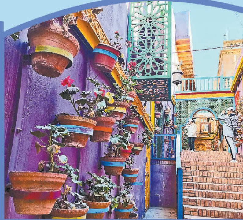
上图 喀什古城里的一条小巷。