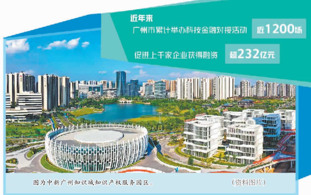
图为中新广州知识城知识产权服务园区。(资料图片)

良好科技金融生态的形成,需要持续优化的政策环境。2023年,广州市地方金融监管局、广州市科学技术局、中国人民银行广东省分行等多部门联合印发《广州市加大力度支持科技型中小企业融资的若干措施》,从制度上明确了金融支持科技型企业的融资支持政策,引导金融资源向各类科技型企业项目、重点科创产业链群集聚。广州还建立并完善科