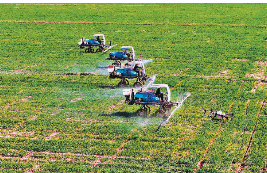
3月13日,江苏省太仓市沙溪镇泰西村高标准农田示范方,农机人员利用无人植保机和自动驾驶机在小麦田间喷洒病虫害药物。早春时节,太仓市各镇区农民抢抓农时,加强田间管理。

“2024年,广州金融系统将继续做好科技金融大文章,加快培育科技企业上市,强化风投融资支持,完善多元化科技金融服务,争创广深科创金融改革试验区。”广州市地方金融监管局局长邱亿通在广州市高质量发展大会金融分会场会议上表示。