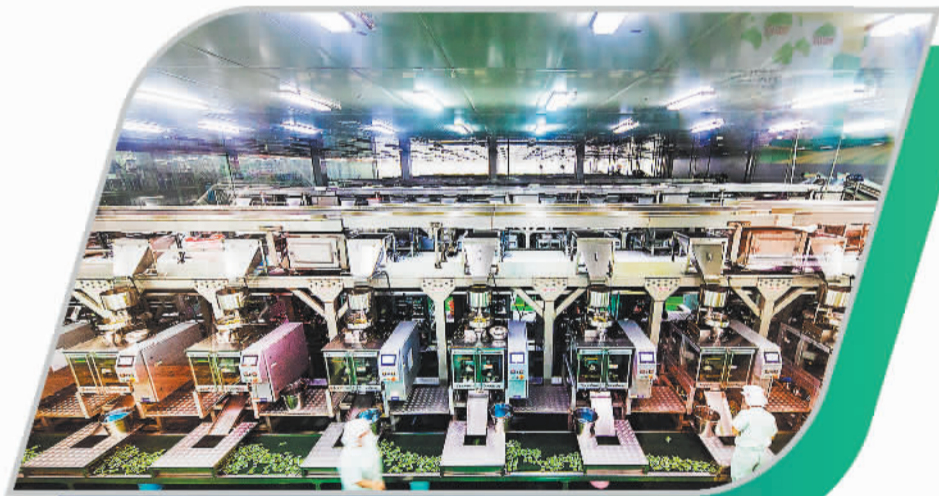
萍乡经开区甘源食品股份有限公司生产车间