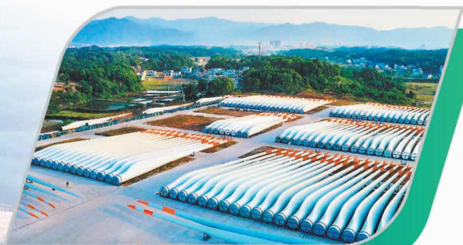
中材科技(萍乡)风电叶片有限公司生产的大型风电叶片整装待发