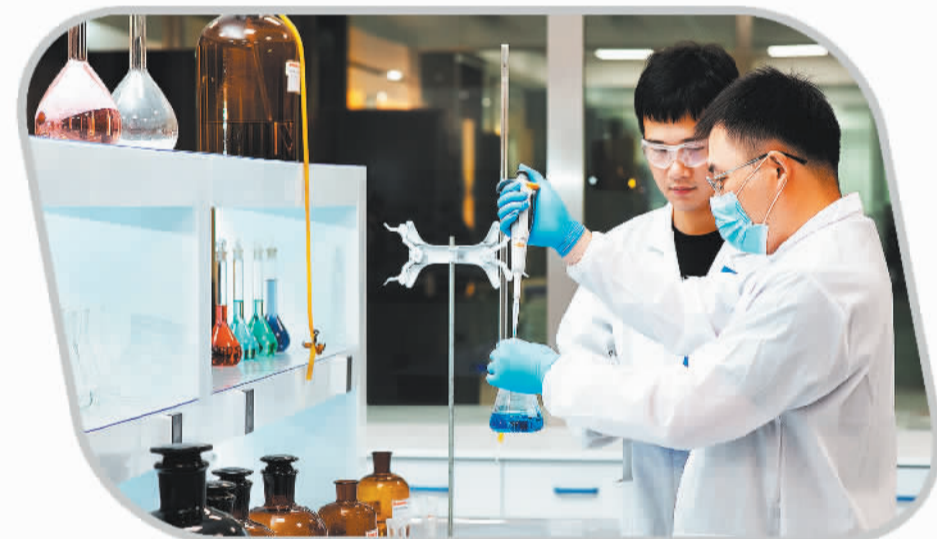
博威集团研发人员在进行化学样品前处理