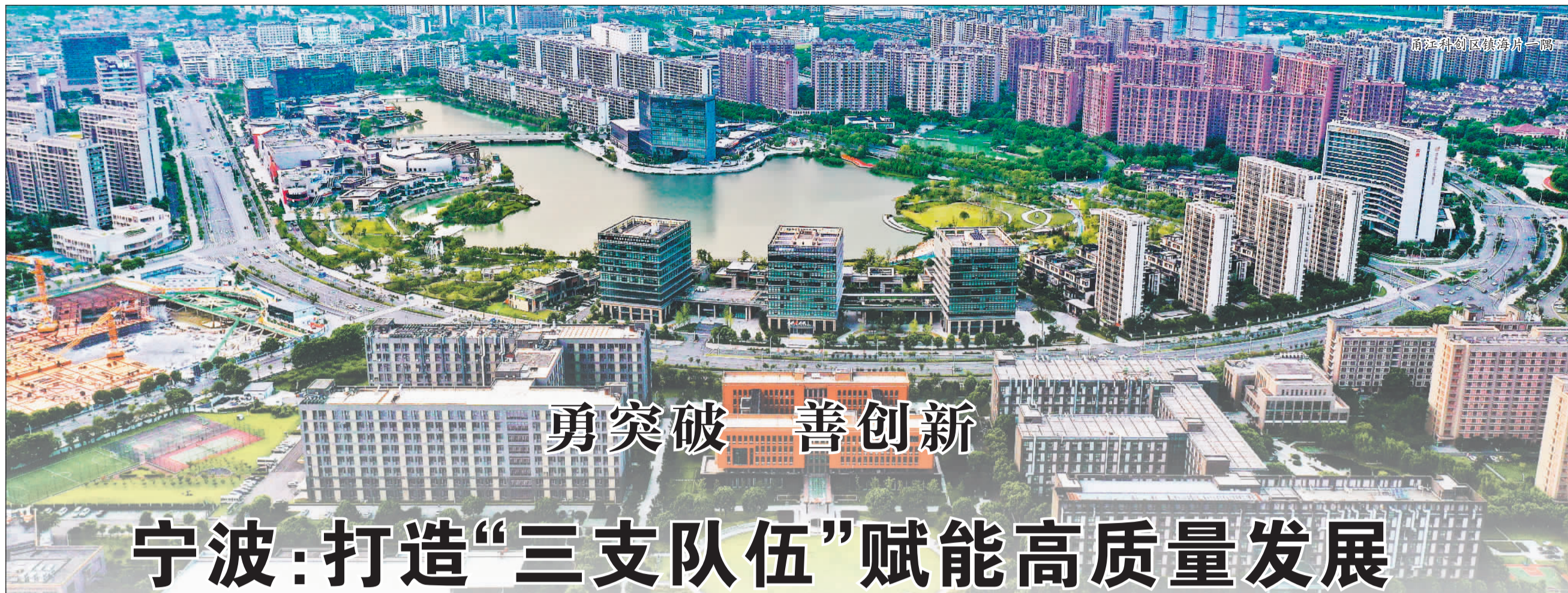
甬江科创区航拍片一隅