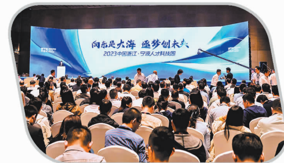
2023年宁波人才科技周