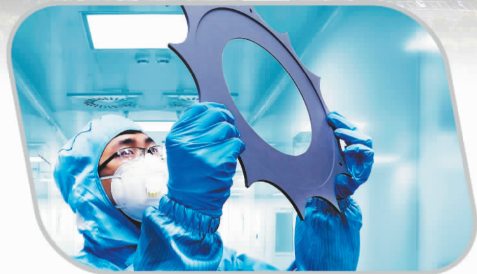
甬江实验室科研成果：高纯SiC涂层托盘