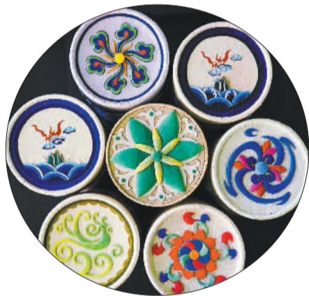
北京工美集团设计制作的吉祥纹样补绣。

本版编辑 李景录 高兴贵 来稿邮箱 jirbsyb58392306@163.com