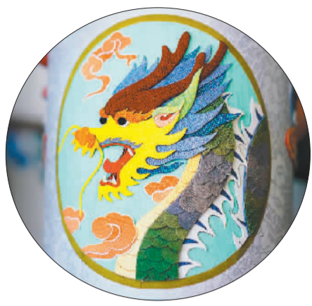
北京工美集团设计制作的龙腾九霄茶叶罐。