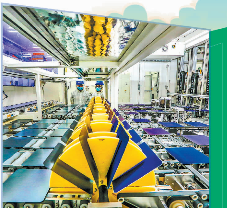
安徽马鞍山经济开发区正奇光能高效电池片项目自动化生产线上,工人们忙着赶制高效晶硅光伏电池产品。