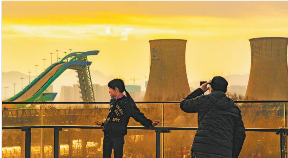
▼游客在首钢园赏景。经过改造修建,首钢园内山水风光交融共生,景观步道交错延伸,一幅奥运元素与工业遗存、历史沉淀与自然景观相融合的画卷铺展在眼前。

本版编辑 李景录 翟天雪 来稿邮箱 jjrbsyb58392306@163.com