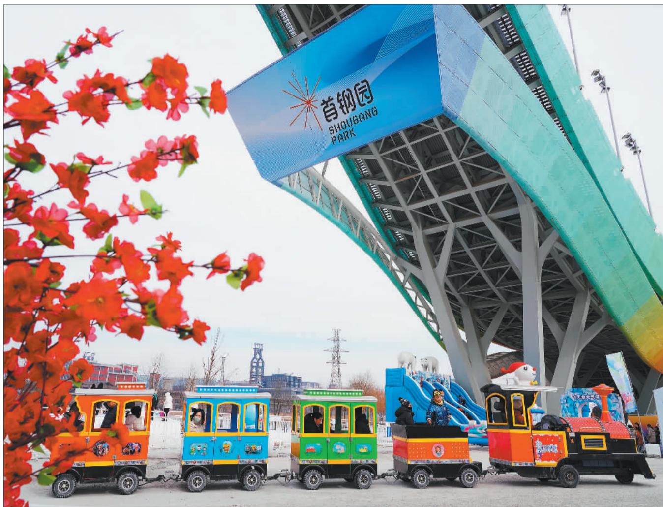
▲北京市石景山区首钢滑雪大跳台,游客参加冰雪汇活动。冬奥会比赛场馆滑雪大跳台面向公众开放以来,经常举办惠民性体育文化活动的。

驾驶车辆穿梭往返,冬奥广场、商业中心、科创园区等建筑群有序分布。冬奥会比赛场馆滑雪大跳台已经面向公众开放,惠民性群众活动可覆盖一年四季。因夏奥而生、因冬奥而兴,百年首钢抓住了奥运机遇实现华丽转身,新时代又赋予其新的使命。从传统老工业区到如今产业集群、活力迸发的高端产业综合服务区,首钢园走出了一条城市更新发展特色之路。