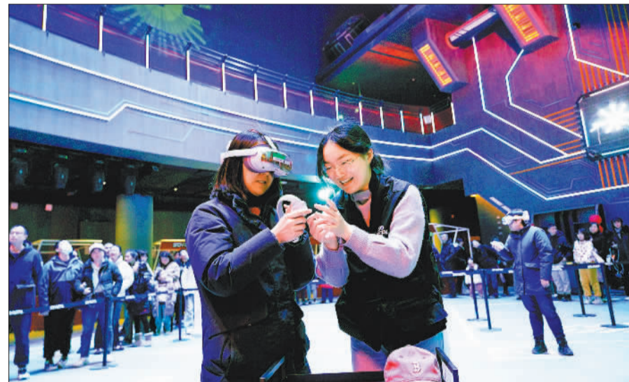
▲游客在首钢园区六工汇购物广场游览。首钢园聚力打造全球首发中心和潮流消费目的地,努力成为北京新型商圈的典型标杆。