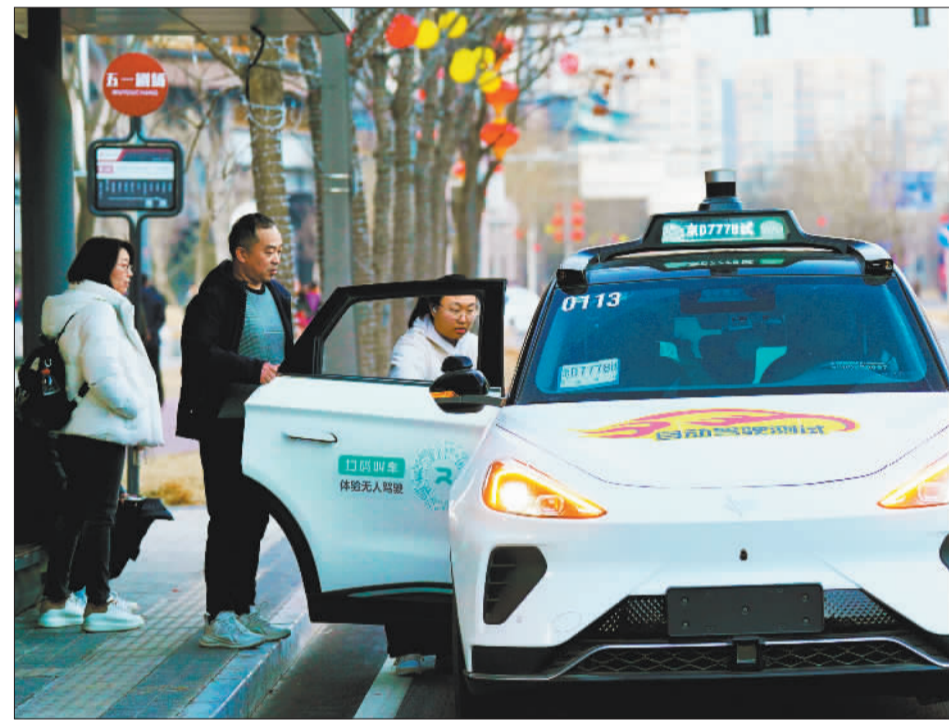
▶在首钢园区,百度共享无人驾驶车穿梭往返,为游客带来智慧、绿色的出行体验。