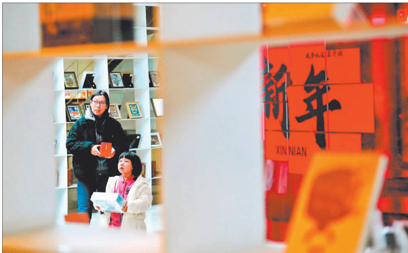
▶读者在首钢园三高炉全民畅读艺术书店选购图书。该书店汇集众多艺术书籍与文创产品,定期举办展览、沙龙等活动,吸引众多读者前来打卡。