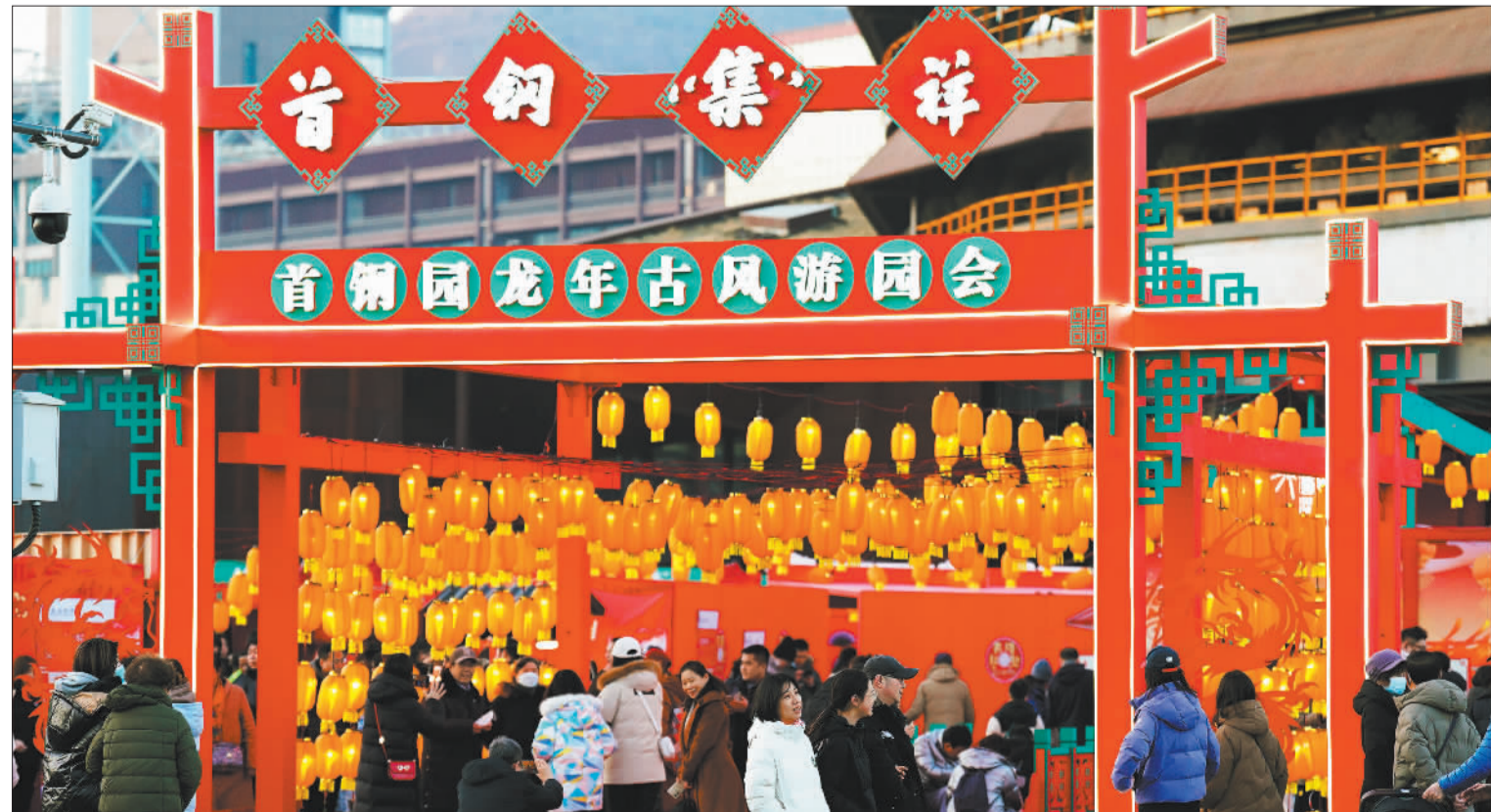
▲游客参加首钢园龙年古风游园会。2023年,首钢园举办各类活动230余场,实现“周周有活动”,全年入园客流量突破1200万人次,实现跨越式增长。