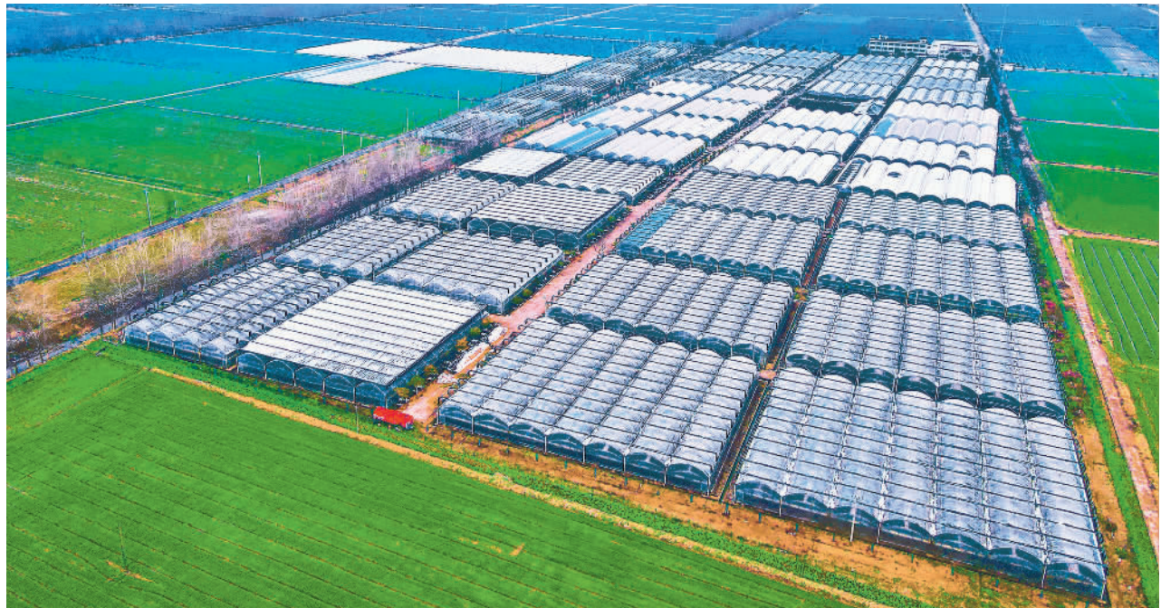
2月23日,江苏省如皋市,农业设施大棚整齐排列。近年来,当地通过政策支持、资金扶持、技术帮扶等举措,规模化、集约化推广现代设施农业,助推绿色瓜果、蔬菜和特色苗木、花卉生产提质增效,带动农民增收,促进乡村振兴。

2023年11月,习近平主席访美期间宣布,中方未来5年愿邀请5万名美国青少年来华交流学习。美国艾奥瓦州友人萨拉·兰蒂近期致信习主席,表示希望马斯卡廷中学也参与这一计划。在习主席关心下,1月24日至30日,作为该项目第一批来华的美国中学生,马斯卡廷中学20多名学生到北京、河北和上海等地进行了交流访问。代表团抵京时,给习主席带来了写有中文“习爷爷,我们来了”字样的校旗等礼物。访问结束后,代表团学生致信习主席,讲述访华之行的喜悦心情,对邀请他们来华交流访问表示感谢。