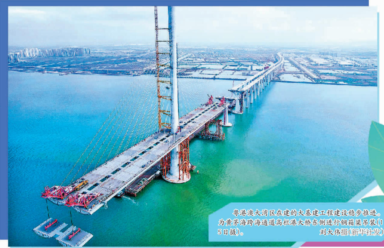
粤港澳大湾区在建的大基建工程建设稳步推进。图为黄茅海跨海通道高栏港大桥东侧进行钢箱梁吊装(1月5日摄)。