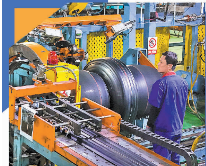
2月21日，在山东省乐陵市经开区一汽车零部件配套企业，工人在载重子午轮胎生产车间忙碌。