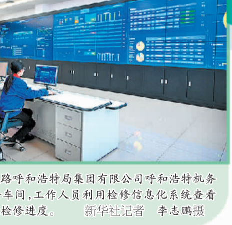
在中国铁路呼和浩特局集团有限公司呼和浩特机务段呼和南检修车间，工作人员利用检修信息化系统查看万吨重载机车检修进度。

区域新增的服务。结合所在区域实时情况，精准为旅客提供安检验证、检票排队、安全提醒、中转换乘等信息，做到非必要不干扰，为旅客营造良好的候车环境。