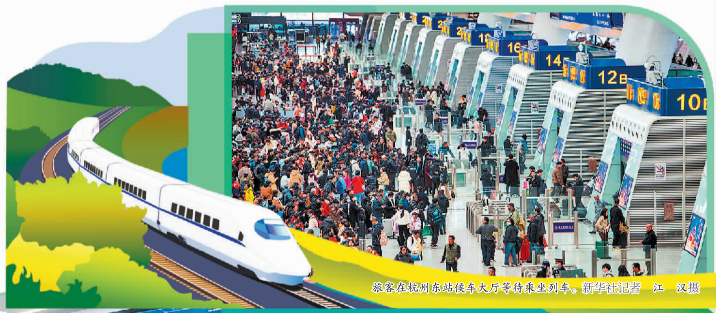
旅客在杭州东站候车大厅等待乘坐列车。