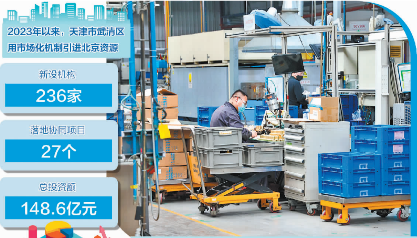
位于天津市武清区的丹佛斯(天津)有限公司生产车间内,质检人员正在工作。

走进铁科纵横（天津）科技发展有限公司生产车间，一系列先进的生产设备正有序运转。该公司副总经理于军说：“车间平均