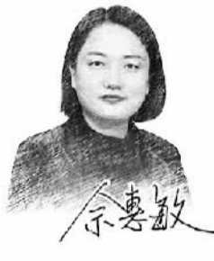
□ 本报记者 马春阳

未来产业具有显著战略性、引领性、颠覆性和不确定性,这也意味着更高的科研伦理风险。伦理规范成为未来产业发展中的“必选项”和“必答题”。期待更多的未来产业建立和完善相关伦理规范,健康有序发展。