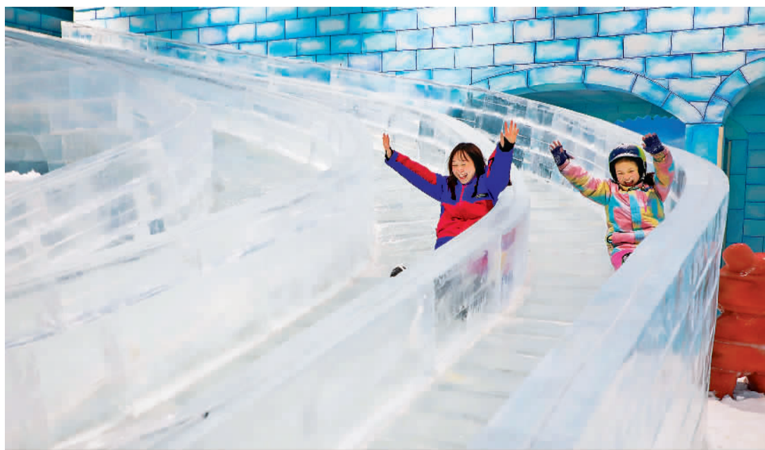
江西省赣州蓉江新区泰迪冰雪世界室内滑雪场,游客正在体验滑冰项目,领略冬季运动魅力。近年来,当地打造集滑雪区、娱雪区、冰雕区于一体的超大室内冰雪世界,吸引了众多游客前来体验,冰雪运动逐渐成为南方地区的新时尚。

刘祥东建议,要逐步探索、开辟多元化的股权投资退出方式,积极开拓并购、协议转让、股权回购、股权清算等多类型退出机制,更好地解决股权融资的流动性问题。同时,还要完善股权退出多元化路径的体制机制建设。通过明确各类股权投资退出方式的适用范围、监管内容和方式等,出台相应的政策支持体系,配套构建相应的市场交易系统,鼓励更多的合格机构投资者参与二级市场基金等创新型产品,助力和保障股权投资多元化退出方式的健康稳定发展。