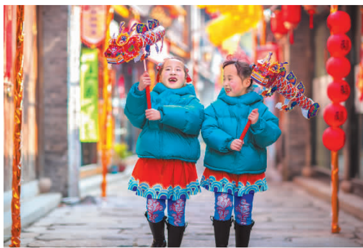
春节假期，各地迎春灯会、花市、庙会、舞龙舞狮等活动丰富，各大景区和商圈游人纷至沓来，越来越多人选择以旅游的方式欢度农历新年。