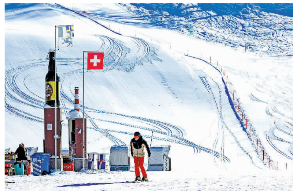
1月16日,一名滑雪爱好者在瑞士达沃斯小镇滑雪。

1月16日,在瑞士达沃斯小镇,一名滑雪爱好者正在滑雪。瑞士国家旅游局中国区主任常典娜在接受采访时表示,中国游客对瑞士旅游业非常重要。常典娜说,瑞士国家旅游局长期以来都将中国市场视为关键。自1998年在中国设立办事处以来,一直积极并且稳步促进瑞士成为中国游客的旅游目的地。新冠疫情暴发前,中国区是瑞士第三大外国客源市场。2023年9月以来,中国区重新成为亚太地区的最主要客源市场。来瑞士旅游的中国游客消费能力高,数据显示人均日消费为380瑞郎(约合3000元人民币)。中国游客不仅体量基数大,而且经济价值高,对瑞士旅游业非常重要。