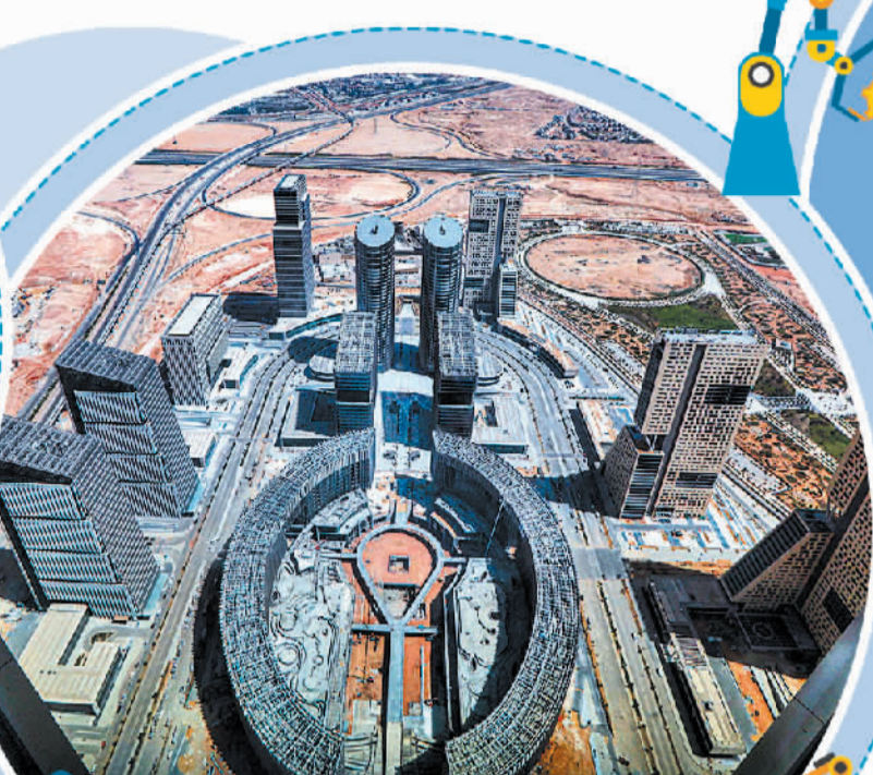
这是2023年9月11日在埃及开罗以东拍摄的建设中的新行政首都中央商务区。

“九项工程”、共建“一带一路”和全球发展倡议,将有关合作资源向支持非洲工业化项目倾斜。