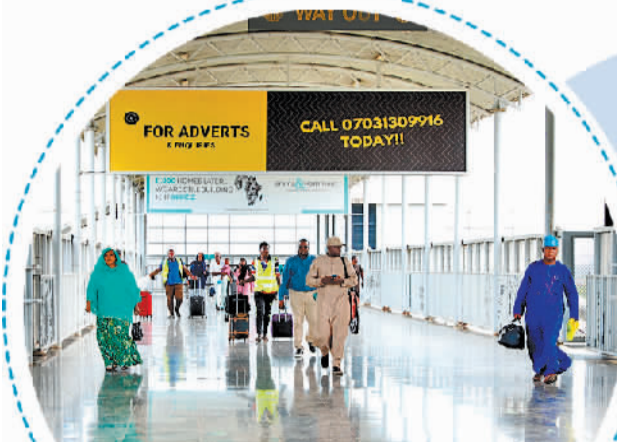
2023年9月18日,在尼日利亚首都阿布的阿卡铁路起点站伊都火车站,乘客进入车站。

2023年8月,中国发布《支持非洲工业化倡议》。中方愿支持非洲发展制造业、数字产业和可再生能源开发建设,加强对非知识产权和技术转移,优化对非贸易便利化措施,扩大非洲优质工业制成品进口,呼吁加快全球金融体系改革并为非洲工业化提供金融支持。中方将结合落实中非合作论坛