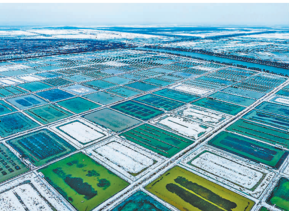
春节临近，江苏省宿迁市泗洪县石集乡迎来螃蟹收获季。泗洪县全县池塘养殖河蟹14万亩。当地积极引导并帮助蟹农秋季捕捞螃蟹集中暂养，错峰推向市场，促进增收。

广铁集团相关负责人表示，接下来，大湾区中欧班列将精准对接大湾区企业需求，推出更多个性化运输线路，并大力发展智慧物流。“新的一年，黄埔海关将进一步优化完善通关保障体系，以中欧班列为纽带，推动共建‘一带一路’国家互联互通，全力推进高水平对外开放。”黄埔海关口岸监管处副处长金振武说。