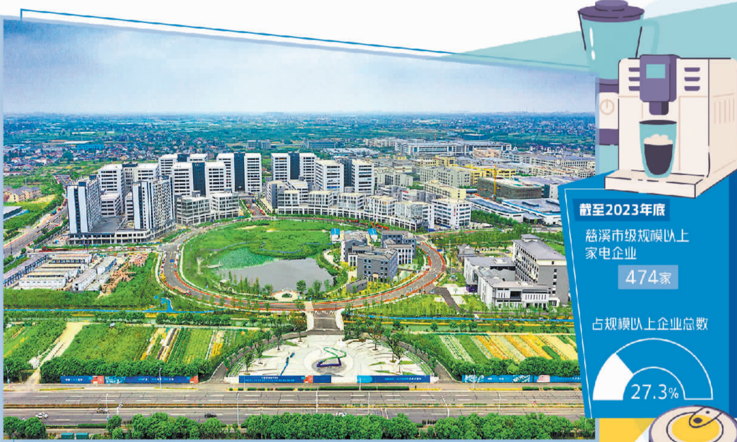
宁波慈溪市小家电智造小镇全景图。