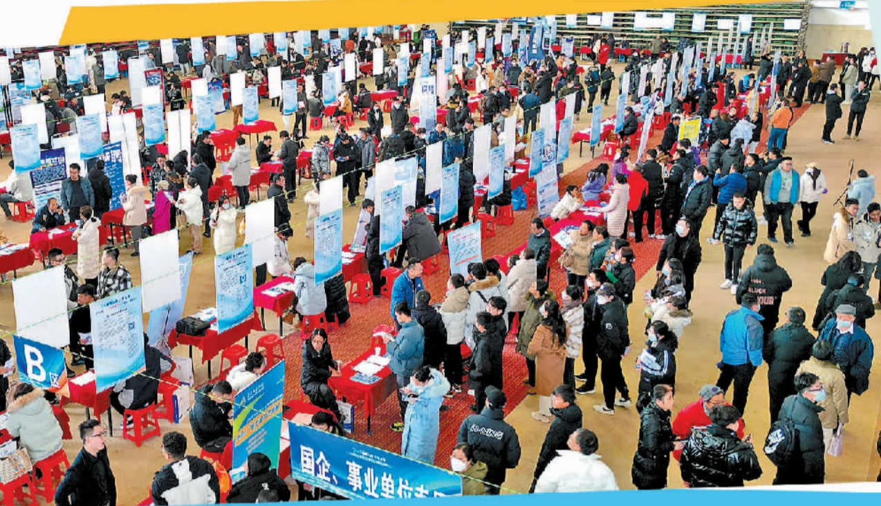
山东省东营市第十三届“东营学子家乡行”大型人才招聘会近日在山东石油化工学院举行。