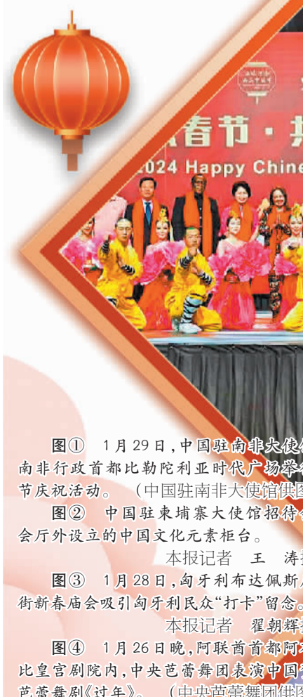
图① 1月29日，中国驻南非大使馆在南非行政首都比勒陀利亚时代广场举行春节庆祝活动。

联、热闹的庙会奏响了农历新年的序曲；“团团”和“圆圆”家的年夜饭彰显了礼仪之邦的待客之道、尊老爱幼的传统美德，一张全家福更传达了中国人对亲情的重视和对团圆的向往；“胡桃夹子”大战“年”兽，则充满童趣地演绎了“过年”