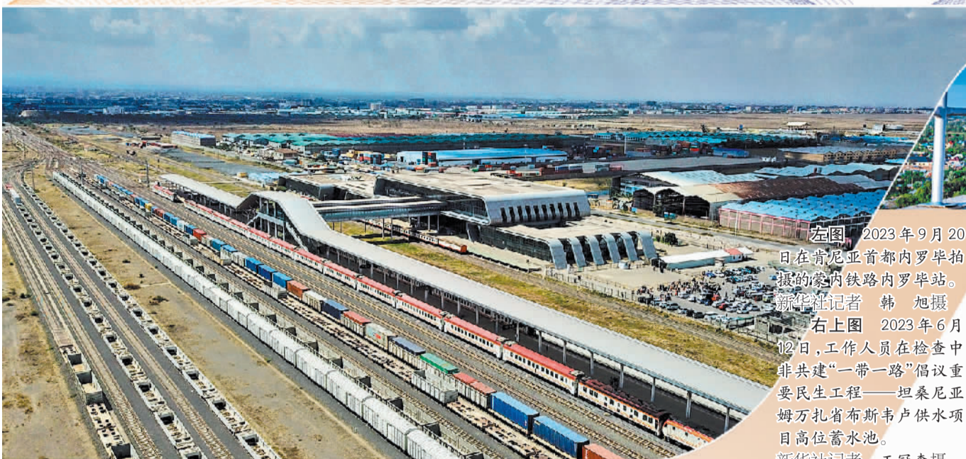
左图 2023年9月20日在肯尼亚首都内罗毕拍摄的肯尼亚铁路内罗毕站。 右上图 2023年6月12日，工作人员在检查中非共建“一带一路”倡议重要民生工程——坦桑尼亚姆万扎省布斯韦卢供水项目高位蓄水池。