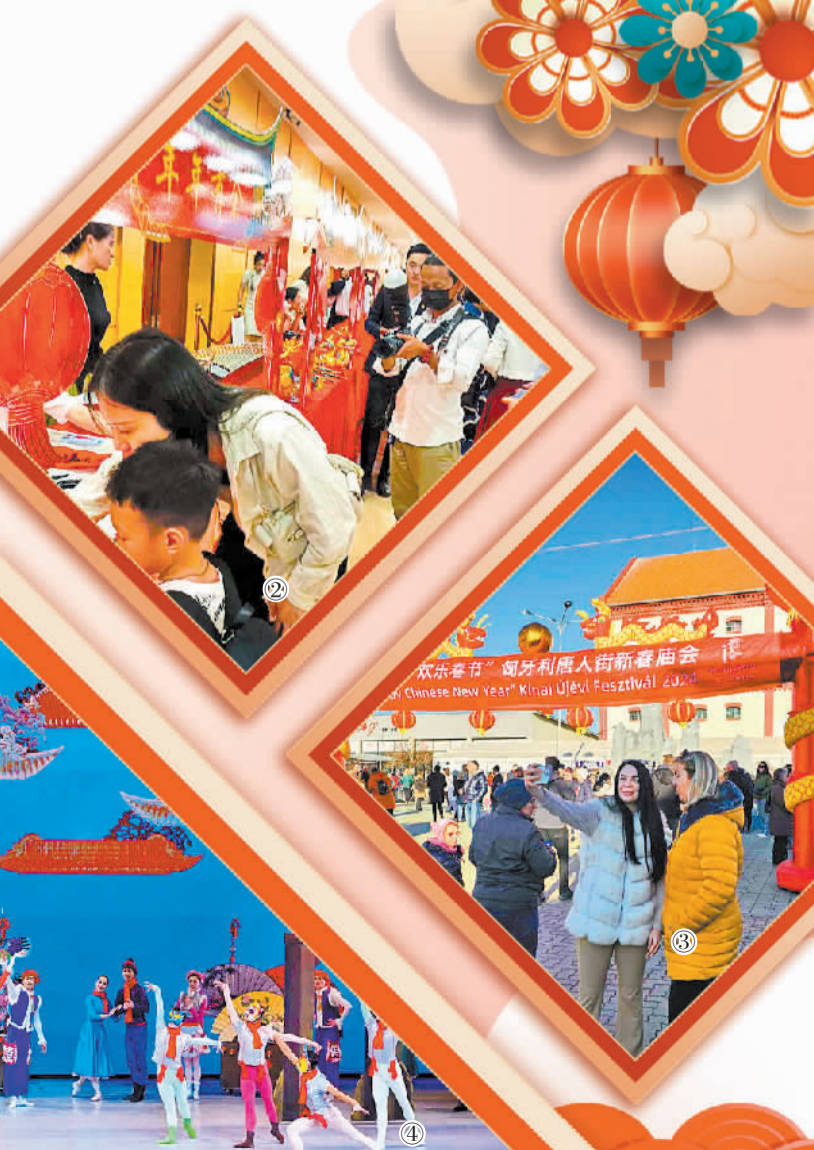
图② 中国驻柬埔寨大使馆招待会宴会厅外设立的中国文化元素柜台。

中央芭蕾舞团将《过年》这部极具中国“年味儿”的舞剧带到阿布扎比国际艺术节，为阿联酋的观众们奉上了一场丰富多彩且充满趣味的艺术盛宴，同时也希望通过这份“新年礼物”，为阿联酋观众送上来自中国艺术家美好、幸福、祥和、团圆的新春祝福。