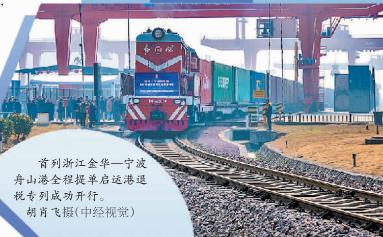
首列浙江金华—宁波舟山港全程提单启运退税专列成功开行。