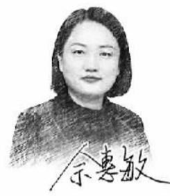
□ 本报记者 勾明扬

心之所向,星河万里。天舟与神舟,均为星汉之舟,承载着中国人的星辰大海之梦。期待中国航天技术在一个又一个探索浩瀚宇宙的工程项目中不断升级,推动我国全面建成世界航天强国。