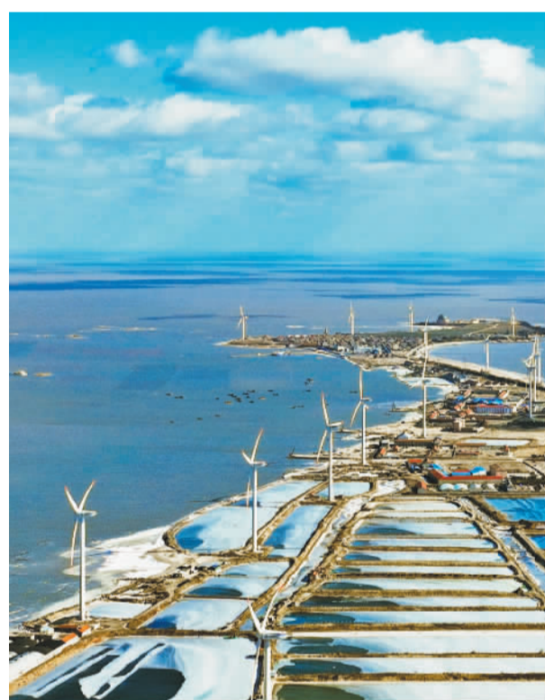
1月24日,山东省荣成市东楸岛风力发电场。近年来,依托沿海风能资源,荣成市建设多处大型风电场、光伏场,推进绿色能源产业发展。