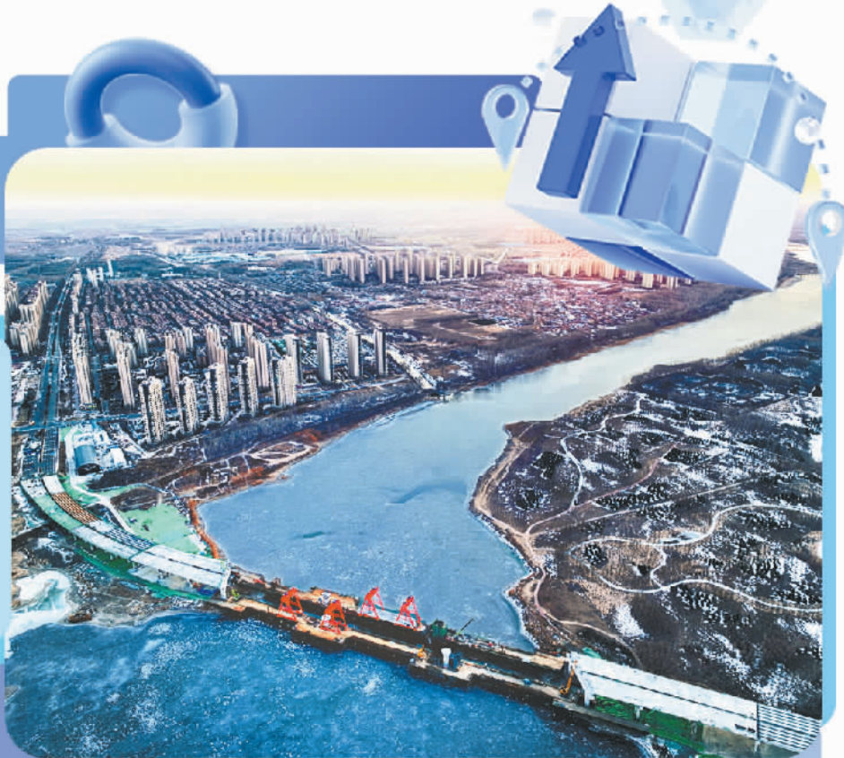
厂通路(河北省大厂回族自治县至北京市通州区)潮白河大桥主桥吊装首段钢箱梁,潮白河大桥主桥即将进入上部结构施工阶段。

近期,红海贸易主动脉遭受的武装袭击引发全球关注。我国仍需拓展外贸蓝海,探索改进现有贸易商品的国际网络,建立更有效的供需连接路径。通过模式或内容创新满足市场需求,实现改进经贸联系、提升全球价值链发展的目的。