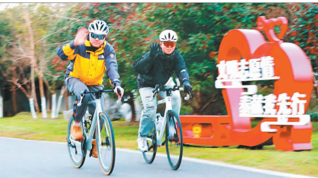
▲骑行爱好者在南通市崇川区五山滨江片区观赏冬日美景。南通市着力打造生态廊道，为市民休闲提供好去处。