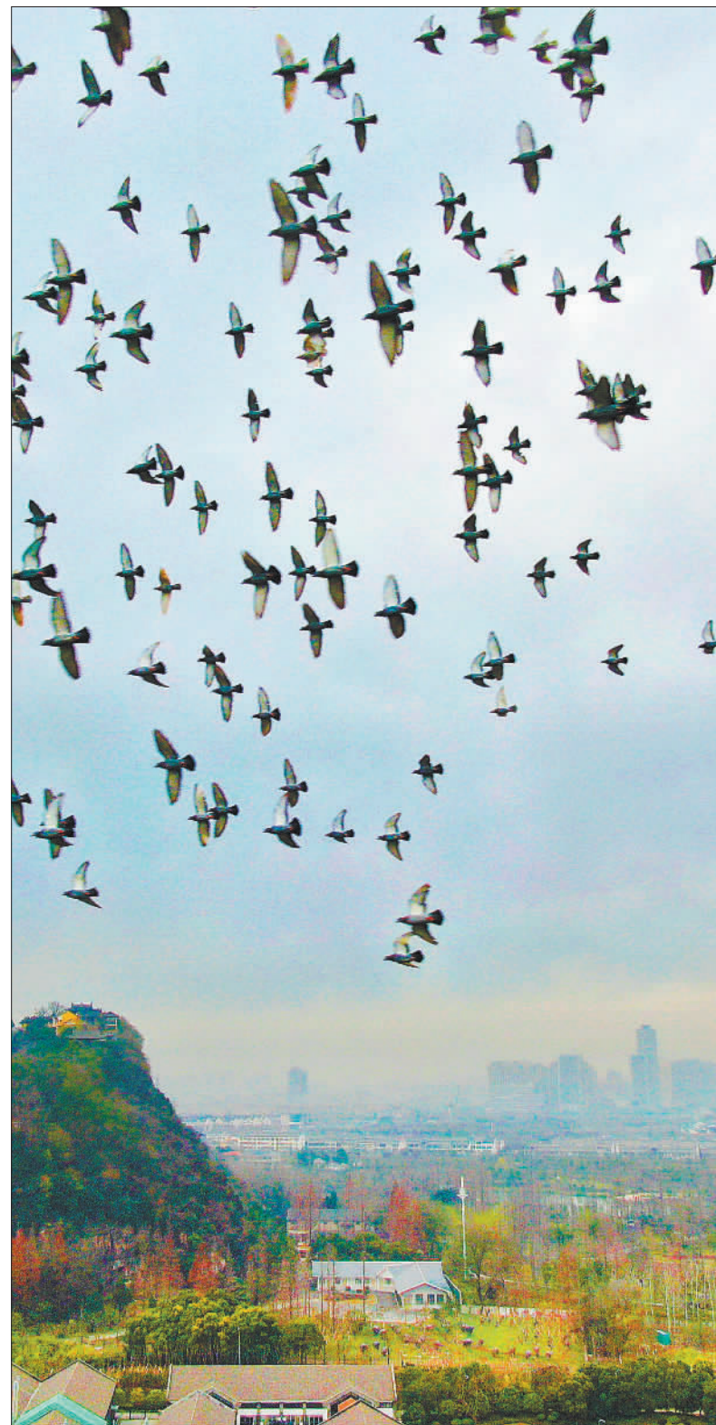
▲南通市狼山国家森林公园上空鸽群飞过。当地通过优化长江岸线布局，打造“面向长江、鸟语花香”的滨江之城。