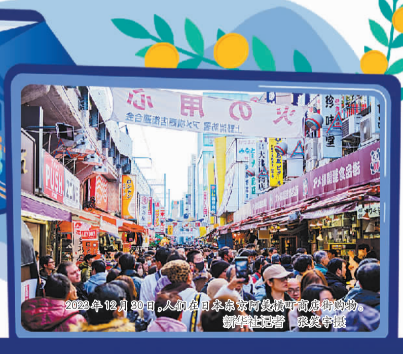
2023年12月30日，人们在东京银座购物。

此外，1月23日公布的经济物价形势展望报告将2024年度除生鲜食品外的核心消费者价格指数（CPI）的上涨率预测值从2023年10月会议上的2.8%下调至2.4%。此外将2023财年（2023年4月至2024年3月）经济增长预期从2.0%下调至1.8%，2024财年经济增长预测值定为1.2%。