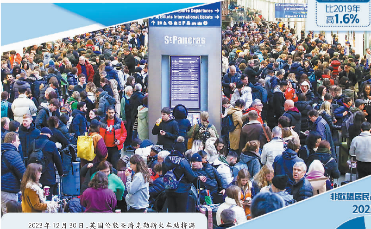
2023年12月30日，英国伦敦圣潘克拉斯火车站挤满旅客。

在航空业持续增长的推动下，各大航空公司恢复航线，成立新的廉价支线公司并开辟新航线，2024年的天空预计将更加忙碌。德国航空巨头汉莎公司拟于夏天起正式开始运营一家新的支线公司，主要经营