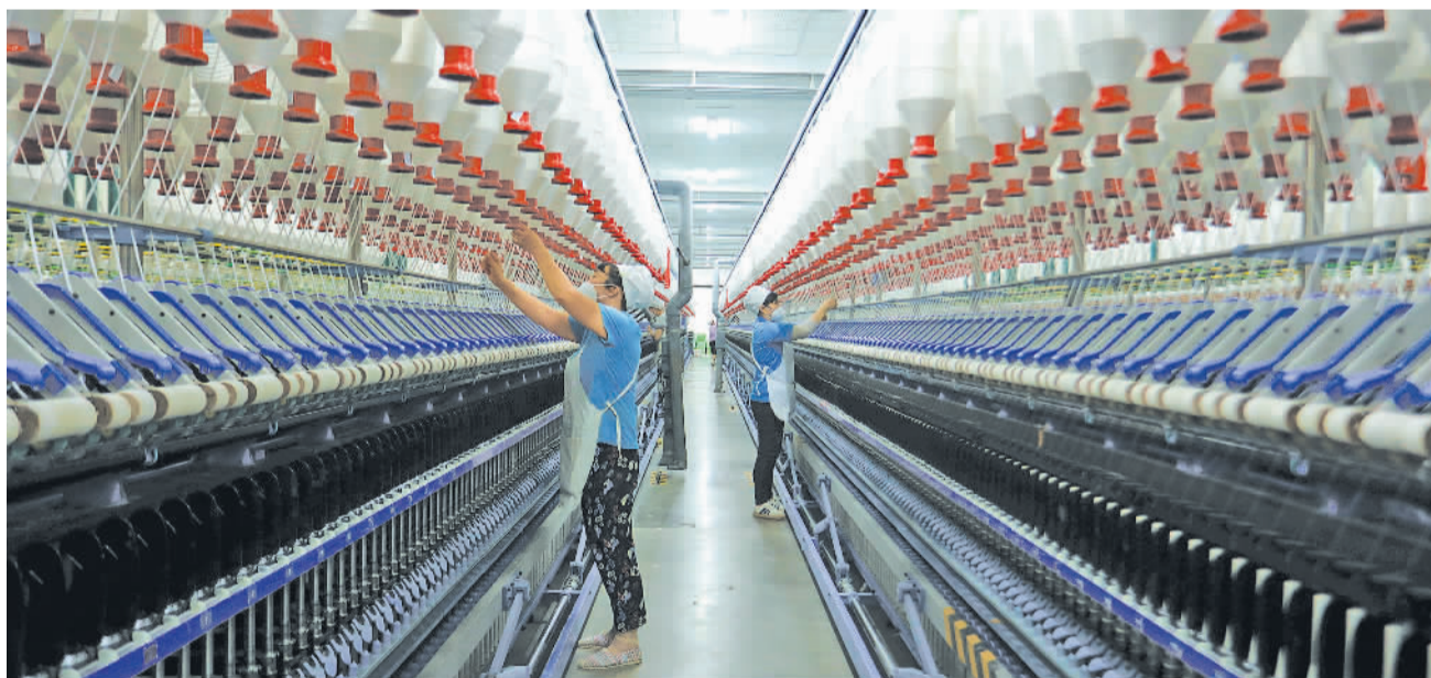
日前,在四川省眉山市仁寿县金鹅纺织有限公司,工人在细纱车间生产订单产品。今年以来,仁寿县不断加大企业的帮扶支持力度,推动企业产销两旺。