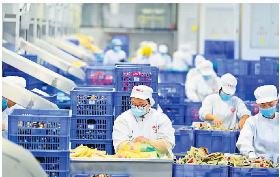
1月22日,工人在柳州螺蛳粉产业园一企业生产车间里包装袋装螺蛳粉。螺蛳粉是广西柳州的特色美食。随着春节临近,订单增多,柳州螺蛳粉产业园各企业开足马力加大生产,供应市场。 黎寒池摄(中经视觉)

据统计,自“一窗通办”运行以来,当地群众办事环节减少89%。全市总事项承诺时限较法定时限压缩95.62%,即办件占比达97.58%。良好的营商环境助推当地实现更好发展效果。2023年,宜都新签约亿元以上项目140个,新开工亿元项目132个,新增经营主体26964家,同比增长61.57%。