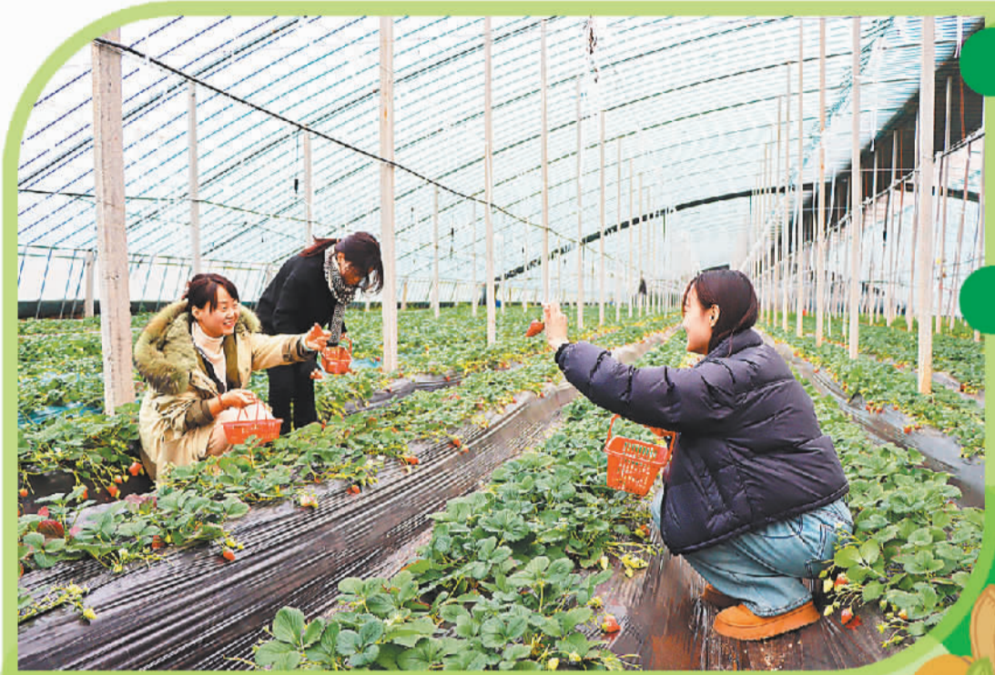
在山东潍坊青州市经济开发区范王村有机草莓采摘园,市民在采摘。

现在,山东村党组织领办合作社达到4.28万家,覆盖4万多个行政村。良好的生态环境是农村宝贵财富。冬日