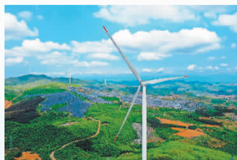
中国人寿投资的中核汇能广西富川风光电场

中国人寿不仅把环境、社会、治理要求嵌入公司经营管理流程和全面风险管理体系，建立健全支持绿色发展的激励约束机制，还丰富完善绿色金融产品服务体系，创新发展绿色保险、绿色投资和绿色信贷，为客户提供综合化、个性化的绿色金融解决方案，助力“双碳”目标实现。特别是充分发挥业务功能作用，积极对接重大绿色优质项目的投融资需求，加大对新能源体系建设的投资和信贷支持，满足传统能源企业转型升级的合理金融需求，支持符合条件的企业发行绿色债券，促进经济社会发展绿色转型。