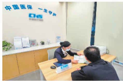
中国人寿工作人员向市民介绍职工医保政策

中国人寿拥有遍及全国城乡的2万多家机构网点、近百万员工和销售队伍。面向更广大客户，尤其是特殊群体和长尾客户，公司致力于开发更多兼具安全性、收益性和流动性的金融产品，不断提升触达能力，加快普惠保险进农村、进社区、进寻常百姓家。在全国范围内，中国人寿大病保险项目200多个，覆盖3.6亿城乡居民，2023年赔款超250亿元。