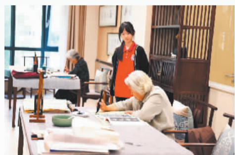
中国人寿旗下国寿嘉园天津乐境养老社区工作人员陪伴入住长者

障、财富管理和健康养老服务，加快个人养老金、商业养老金、商业养老保险、健康保险、养老储蓄、养老资管产品等重点业务发展。特别是深度融入三支柱养老保险体系建设，积极拓展第一支柱业务、巩固提升第二支柱领先优势、深耕细作第三支柱。另一方面，聚焦养老产业投资布局和专业能力建设运营，轻重结合提供养老综合解决方案，积极构建多层次多模式的养老服务体系，形成中国人寿养老服务标准和管理输出。