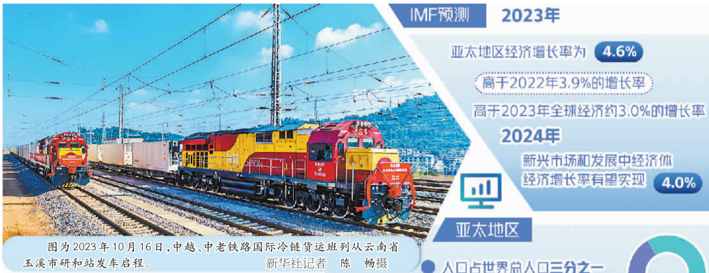
图为2023年10月16日,中越、中老铁路国际冷链货运班列从云南省玉溪市研和站发车启程。

回顾2023年的世界经济,总体充满各种不确定性因素,各主要经济体表现参差不齐,经济增长快慢有别,亚太地区经济表现相对比较亮眼。展望2024年,虽然联合国(UN)、国际货币基金组织(IMF)和经济合作与发展组织(OECD)等国际性组织均预测今年世界经济增速有所放缓,但亚太地区经济将继续领跑,依然被众多国际组织和部分经济界专家学者看好。 日前,总部位于英国的国际市场调查和研究机构欧睿国际发布《全球经济预测:2024年展望》报告指出,亚太地区的新兴经济体将继续引领全球增长。 2024年,亚太地区经济被世界持续看好并继续展现韧性的原因主要有如下几个方面: 追求和平发展已成全球共识。目前,地缘政治博弈加剧,各类矛盾与冲突层出不穷,多边主义和贸易自由化受到威胁,世界经济发展遇到瓶颈,美国等西方国家将经济意识形态化和武器化愈演愈烈,都对世界经济的稳定和发展造成了严重威胁。与此同时,世界上绝大多数爱好和平与追求公平正义的国家,已经认识到了维护世界和平和内部稳定对经济发展的重要性,愿意与他国平等互利、和平共处、合作共赢。这为2024年世界经济实现增长提供了必要环境。 亚太地区经济依然充满活力。亚太地区人口占世界总人口的三分之一,经济总量占全球的近七成,贸易额占世界的近一半,多年来亚太地区的经济增长率位居全球前列,对全球经济的贡献率高达三分之二,这种趋势目前来看仍将持续。亚太地区国家具有要素资源丰富、市场规模巨大、资源禀赋各异、经济互补性强、世界主要经济体和发达经济体云集等优势。与此同时,亚太地区是全球经济最具活力的增长带,也是推进数字化进程、发展数字经济的先行区和示范区。据有关机构预测,2023年亚太地区数字经济对整体经济产值的贡献率有望达到65%;地区内三分之一的企业内部通过数字产品和服务创造的营业收入占比有望超过30%,数字化正在重塑亚太地区经济。2024年,亚太地区经济在沿袭2023年良好增长势头的基础上,有望迎来需求逐步回升、旅游业继续反弹、消费回暖、贸易止跌企稳向好、部分国家通胀压力下降等新局面。 区域国家合作意愿强烈。在亚太地区