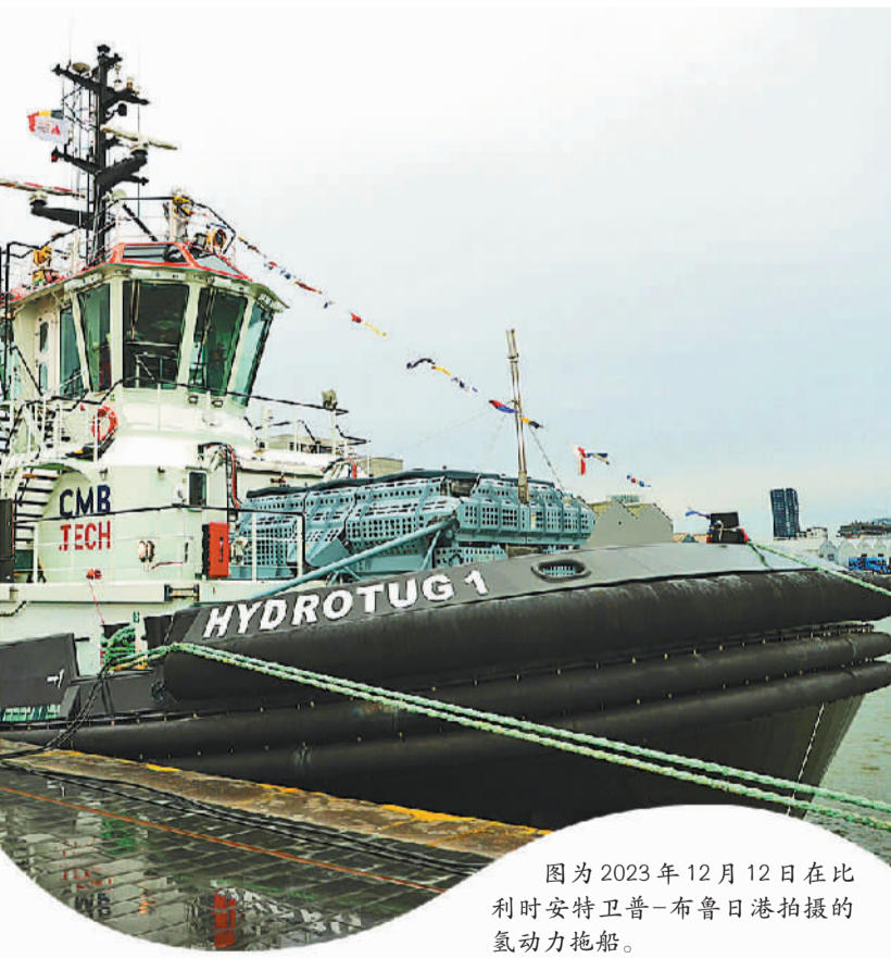
图为2023年12月12日在比利时安特卫普-布鲁日港拍摄的氢动力拖船。

为了应对这些迫在眉睫的挑战,欧盟在《计划》中明确了重点发力的7个关键领域,包括加速现有项目实施及新项目开发、加强长期网络规划、引入前瞻性监管框架、提高电网智能化水平、拓宽融资渠道、精简许可审批流程和不断完善供应链等。《计划》针对上述每一个领域提出了具体的行动设想。 例如,在前瞻性监管政策部分,《计划》讨论了离岸可再生能源项目问题。《计划》认为,能源岛和其他大