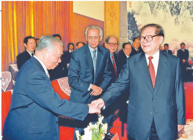
2002年2月8日,中共中央举行党外人士迎春座谈会。这是江泽民同志和张克辉同志握手。