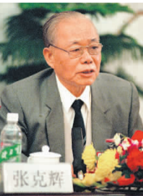
左图:1998年3月6日,张克辉同志参加全国两会新闻中心举行的首次记者招待会。