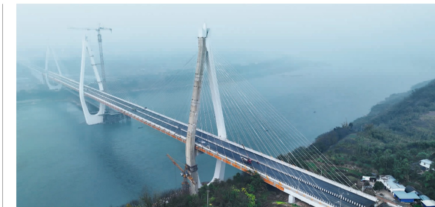
1月13日，位于四川省宜宾市江安县的江安第二长江大桥项目现场，工人正在铺设沥青、安装路灯，为春节前通车做准备。该桥通车后，将提升当地城乡交通运输水平，缓解区域内长江南北两岸交通压力。

展望2024年，投资增速有望较2023年有所上升。杨萍认为，扩大有效益的投资空间大，机遇多。一是储蓄率高，投资率低于储蓄率，储蓄—投资转化有空间；二是民间投资增长空间大。全球新一轮科技革命和产业变革，应对气候变化等蕴含的大量投资机遇，为民间投资增长提供了广阔空间。三是宏观政策环境有利有力。无论是2023年新增的1万亿元国债，还是2024年实施的合理扩大地方政府专项债券用作资本金范围等政策，都将对投资发挥积极作用。