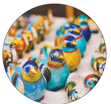
系列景泰蓝工艺品

“景泰蓝工艺品需经大大小小108道工序才能完成，制作工艺复杂，似在铜上绣花。”国家级非物质文化遗产景泰蓝制作技艺代表性传承人钟连盛介绍。