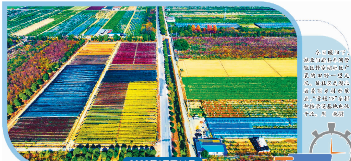
冬日暖阳下,湖北阳新县率洲管理区钟家湖社区广袤的田野一望无垠。该社区是湖北省美丽乡村示范点,“爱媛28”杂树种植示范基地也位于此。

村香菇基地年种植规模可达20万棒,年产值有望突破250万元,每年可增加村集体收入10万元以上,带动60余人就业,人均可增收3000余元,促进一二三产协调发展。