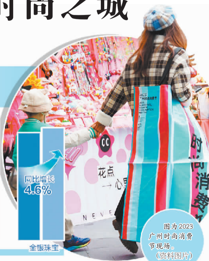
图为2023广州时尚消费节现场。(资料图片)

如今,广州白云区正积极推动建设广州时尚之都,将谋划近千亩产业用地,打造时尚企业总部基地、国际潮流发布中心、亚洲消费体验中心。目前,广州时尚之都石井启动区已启动建设,该园区已落地重点招商投资项目5宗,包括沃尔玛山姆会员旗舰店广州首店、白云站西地块场站综合体等,投资额约70亿元;在谈项目39宗,包括广汽租赁、广东省服装协会、广东省皮具协会等,预计投资额约167亿元。