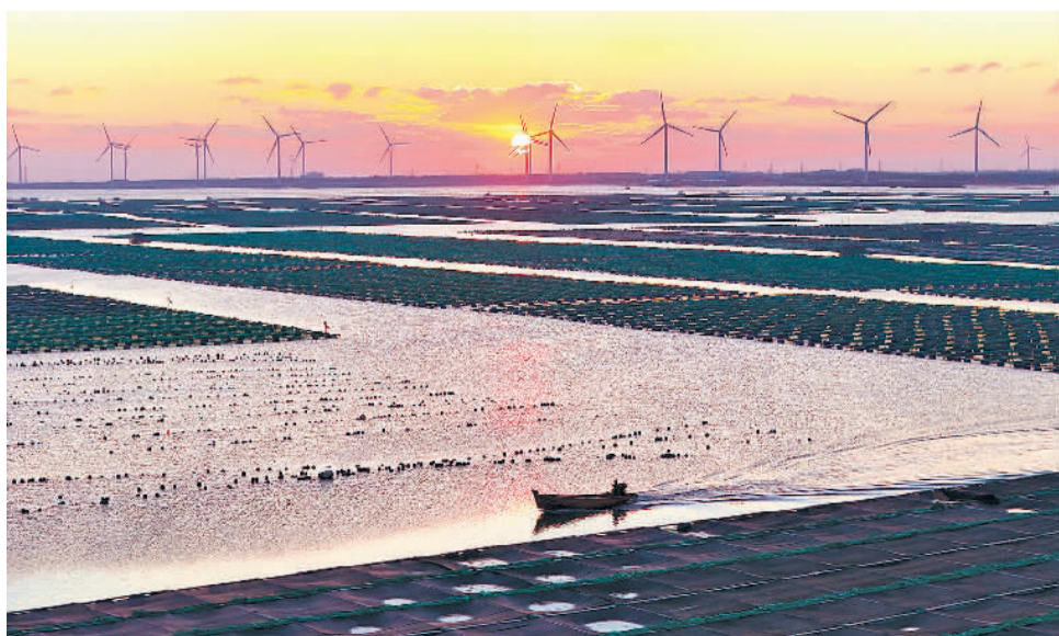
1月10日,山东省荣成市桑沟湾畔旭日东升,养殖工人驾驶船只披着朝阳出海进行海上冬季养殖管理。桑沟湾水质优良,海产丰富,建成我国北方最大规模的海上网箱养殖基地,沿海渔民收海耕渔,走上致富路。

2022年,湖北发出号召,动员党员干部下基层、察民情、解民忧、暖民心,倡导用“共同缔造”的价值观与方法论去办实事、解难题。一年多来,共同缔造理念春风化雨润物无声,办成了一批好事实事,探索了一批制度成果,打开了乡村共谋、共建、共管、共评、共享的新时代社会治理新格局。