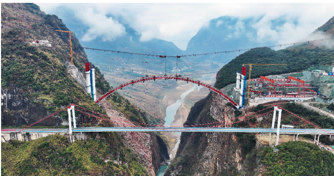
1月11日，由贵州公路集团承建的贵州纳（雍）晴（隆）高速公路乌蒙山大桥主拱圈右幅合龙。乌蒙山大桥是纳晴高速的控制性工程之一，位于六盘水市六枝特区中寨乡，是世界首座采用钢桁腹杆—混凝土组合的拱桥。

（一）优化国土空间开发保护格局。健全主体功能区制度，完善国土空间规划体系，统筹优化农业、生态、城镇等各类空间布局。坚守生态保护红线，强化执法监管和保护修复，使全国生态保护红线面积保持在315万平方公里以上。坚决守住18亿亩耕地红线，确保可以长期稳定利用的耕地不再减少。严格管控城镇开发边界，推动城镇空间内涵式集约化绿色发展。严格河湖水域岸线空间管控。加强海洋和海岸带国土空间管控，建立低效用海退出机制，除国家重大项目外，不再新增围填海。完善全域覆盖的生态环境分区管控体系，为发展“明底线”、“划边界”。到2035年，大陆自然岸线保有率不低于35%，生态保护红线生态功能不降低、性质不改变。