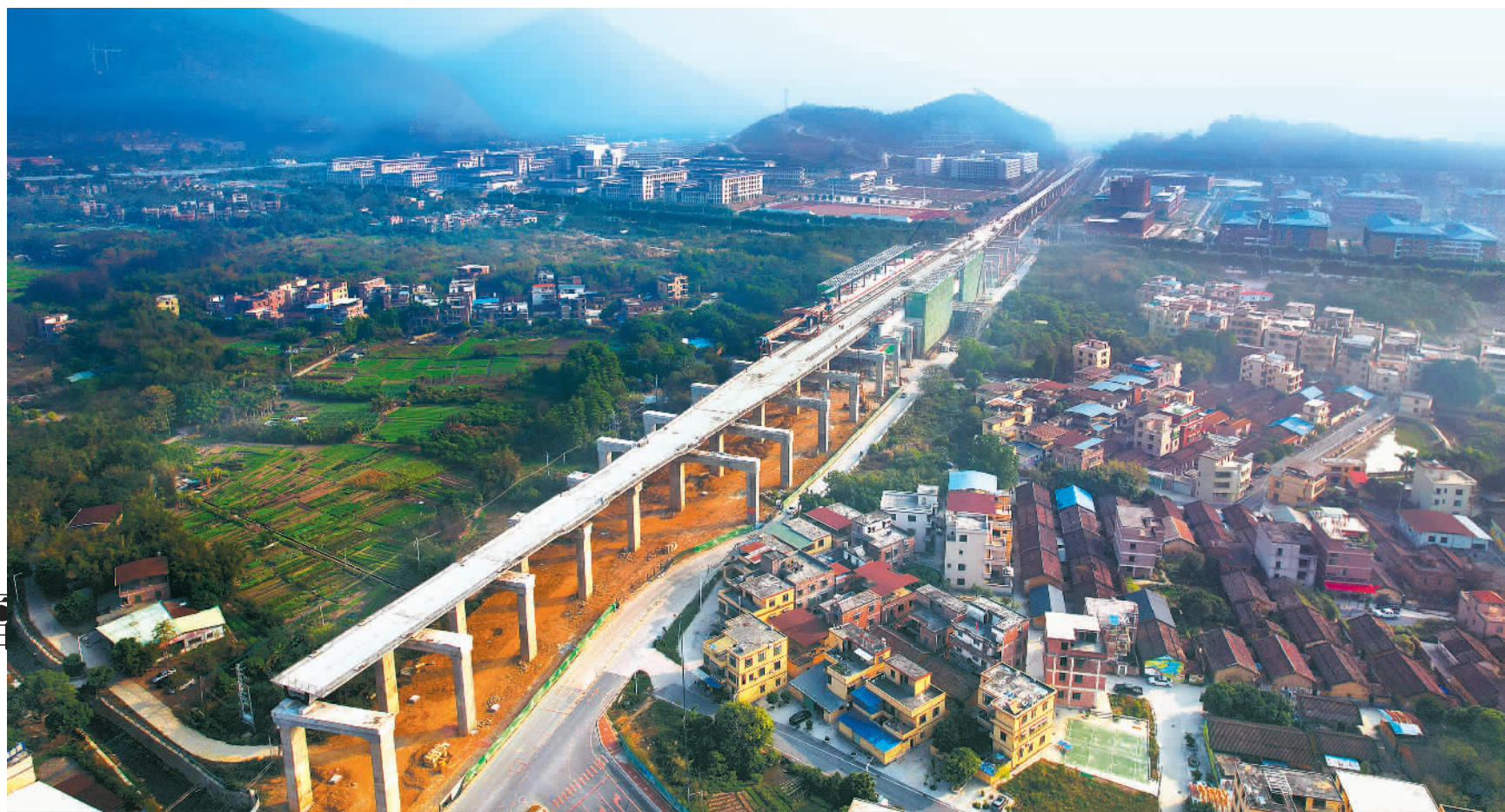
1月6日,由中铁二十二局参建的粤港澳大湾区城际铁路项目——广州(清)远)城际北延全线路预制箱梁架设完成。作为珠三角城际铁路的重要组成部分,该项目对于打造广清一体化和大湾区“1小时交通圈”具有重要作用。

目前,普兰店区以党建链串起了产业链,共建致富链,累计带动群众增收1119.5万元,助力村集体增收826万元。