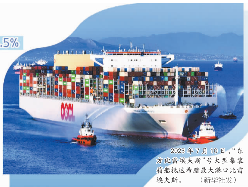
2023年7月10日，“东方比雷埃夫斯”号大型集装箱船抵达希腊最大港口比雷埃夫斯。

过去一年，希腊政府持续深化经济改革，在控制通胀、稳定物价、保障就业等领域取得的成就令人瞩目。希腊2023年度的经济表现被《经济学人》杂志评为全球经济表现最佳的35个发达国家之首，这也是希腊连续第二年被评为第一名。