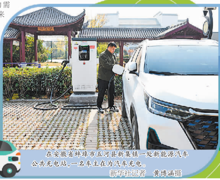
在安徽省蚌埠市五河县新集镇一处新能源汽车公共充电站,一名车主在为汽车充电。

全宗旗表示,未来的充换电行业一方面要高品质发展,另一方面提供差异化服务。在新能源汽车销量快速增长的背景下,换电赛道日益成为产业投资的热门领域。近年来,车企已经成为换电市场中的主力之一,同时,宁德时代、南方电网、国家电网、中石化、中石油等企业也纷纷布局换电市场,投建了大量的换电站和“电池银行”。