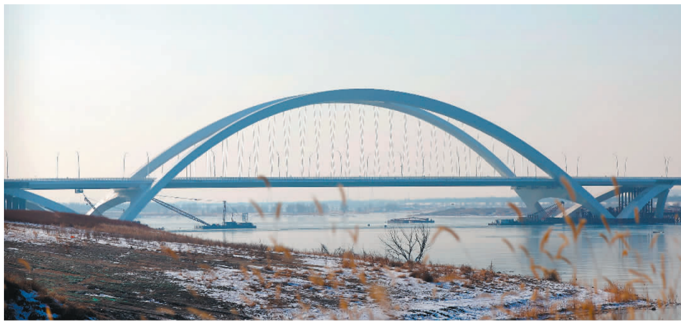
12月28日拍摄的京雄高速公路全线控制性工程京雄大桥。当日,京雄高速全线通车运营。