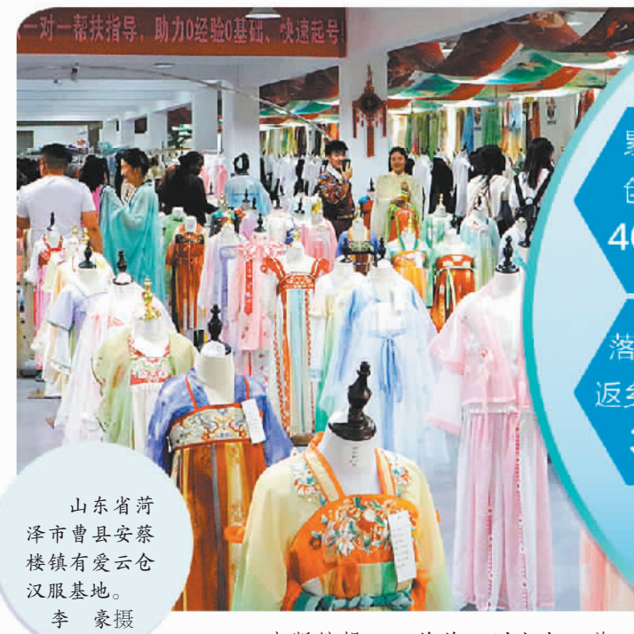
山东省菏泽市曹县安蔡楼镇有爱云仓汉服基地。

乘势而上为产业发展积蓄新动能。在发展过程中，菏泽善于将外部环境的“势”转化为自身发展的“机”，并借助各种各样的“机”塑造发展新优势。在打造特色产业链过程中，菏泽围绕龙头企业的发展需要延链补链，帮助企业打造竞争优势。同时，完备的产业链能够吸引更多企业到菏泽投资兴业，进一步推动主导产业的发展。