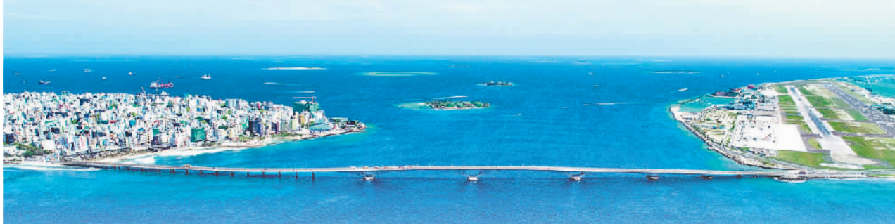
图为航拍的连接马尔代夫首都马累和机场岛的中马友谊大桥。