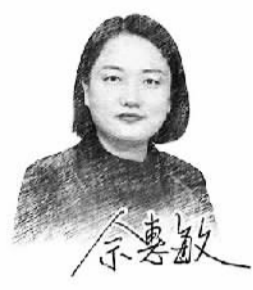
□ 本报记者 王宝会

石岛湾核电站的成功商运,是一块成色十足的金牌。中国的核能科学家和工程师团队研发出以固有安全为主要特征的先进核能技术,实现了从跟跑、并跑到领跑世界的跨越,并在第四代先进核能的赛道上,跑出了遥遥领先的阵势。