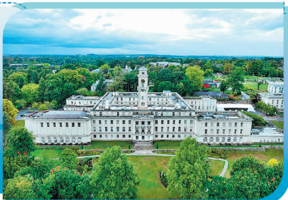
图为英国诺丁汉大学。